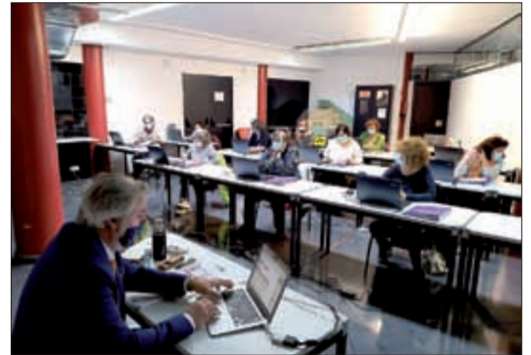
Imatge de la sessió de formació que es va fer

Una vintena de persones van començar ahir una formació sobre el món digital i noves tecnologies organitzada per Pallars Actiu, juntament amb la Cambra de Comerç de Lleida i en col·laboració amb el Consell Comarcal del Pallars Jussà, adreçada a persones en situació d'atur de més de 45 anys. L'objectiu de la formació és millorar el posicionament