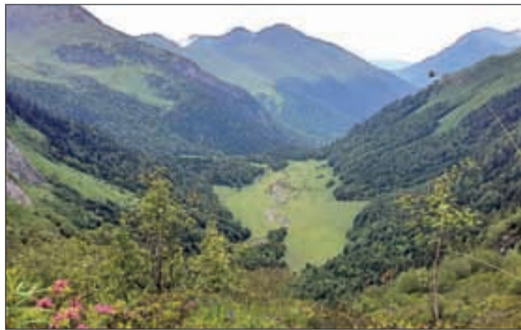
Imatge de la Val dera Artiga de Lin, a la Val d'Aran