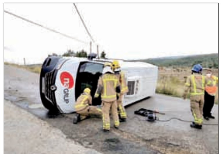
Estat en què va quedar la furgoneta bolcada a Torrebesses

Un conductor va resultar ahir ferit de caràcter menys en patir una sortida de via quan el seu turisme va sortir-se de la via al quilòmetre 104,5 de la C-12, a Maials. Va ser traslladat en ambulància a l'Arnau de Vilanova. D'altra banda, al carrer Onze de Setembre de Torrebesses va bolcar una furgoneta frigorífica, tot i que cal destacar que el xofer va ser il·lès.