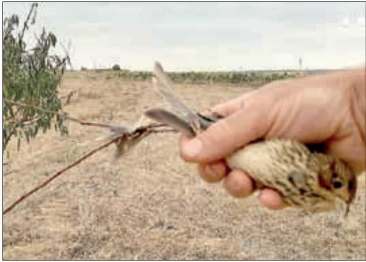
Un dels ocells que havien capturat els caçadors