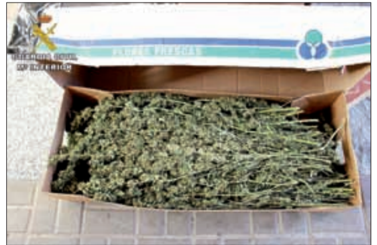
Imatge de les com anava amagada la marihuana

Els prop de 100 quilos de marihuana van ser comissats el passat mes d'agost per una patrulla de l'Agrupació de Trànsit de la Guàrdia Civil de Villena (Alacant), que va donar l'alto al vehicle a l'autovia A-31, al terme municipal alacantí de Novelda, per una infracció a la llei de seguretat viària.