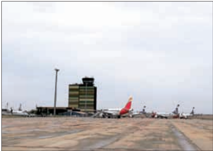
L'aeroport d'Alguaire amb diversos avions a la pista

dat al Centre de Fauna de Vallcalent per a la seva neteja i recuperació. Així mateix, van indicar que les dues persones ha havien estat denunciades als jutjats el gener per la mateixa activitat. Es tracta d'un delictes contra la fauna i es presentarà atestat davant del jutjat d'instrucció. Cal indicar que una va ser denunciada també per circular camp a través, sense tenir carnet de conduir i amb la ITV caducada.