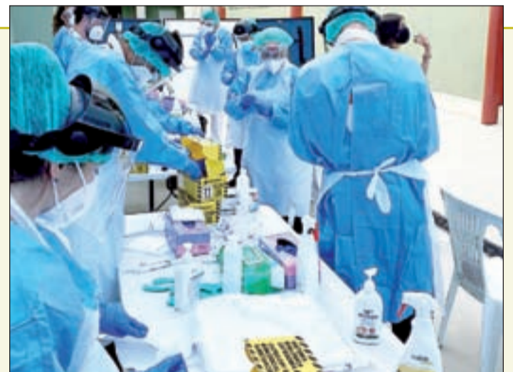
Els col·laboradors realitzant les proves

La demarcació de Lleida compta amb 50 alumnes confinats menys que el dijous. Així, actualment hi ha un total de 97 grups confinats a tota la demarcació que impliquen l'afectació de fins a 2.205 alumnes. En comparació amb les dades obtingudes a través de l'aplicació Traçacovid el passat dijous, 267 alumnes han tornat a les aules. En referència al recompte de positius, en els darrers 10 dies s'han donat 132 casos, 50 menys dels que hi havia dijous. També el nombre de confinats a disminuït de 108 a 97 grups. Per comarques i municipis, el Segrià compta amb 21 grups confinats, l'Urgell amb 17, la Segarra i Solsona amb 16, la Seu d'Urgell amb 15, les Garrigues amb 8, la Noguera amb 6 i el Pallars i Pont de Suert amb 2.