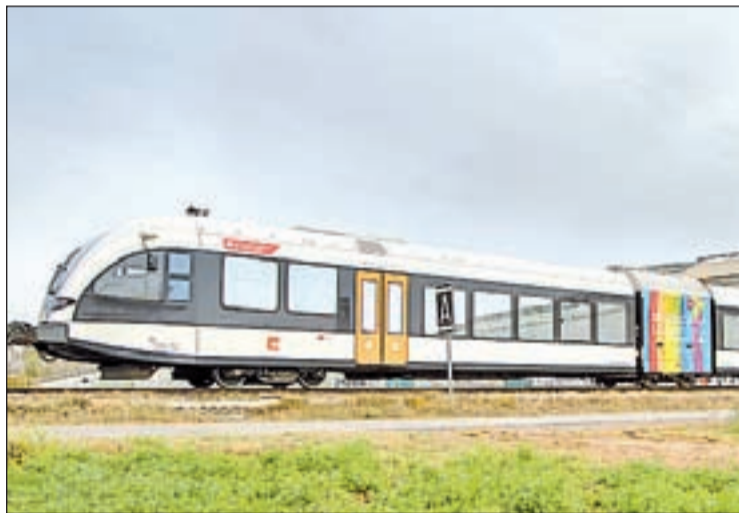
Imatge d'un dels combos amb el vinil de la campanya

El tren de Lleida a la Pobla s'ha sumat a la campanya de Ferrocarrils (FGC) i el Departament de Treball, Afers Socials i Famílies contra la LGTBIfòbia. Es combos s'han vinilat amb les imatges de la campanya que a més emet spots a les estacions de FGC que mostres com denunciar les actituds LGTBIfòbiques.