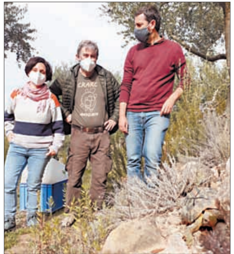
Es realitzen seguiments periòdics a les tortugues