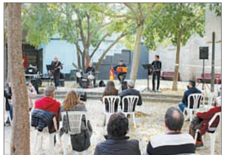
Els Xicots de l'Esplai també van actuar ahir a Tàrraga