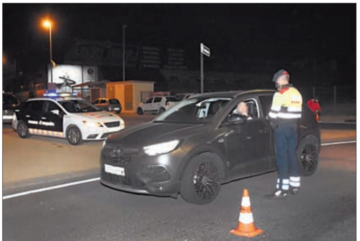
Los Mossos controlan que se cumpla el confinamiento nocturno TEMA DEL DIA | PÁG.3-7