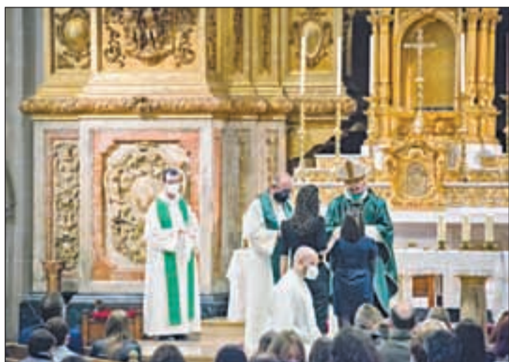
El bisbe va oficiar la cerimònia ahir al migdia