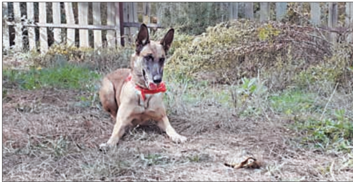
Els gossos de l'ONG Trenca ajuden a buscar les tortugues per poder-ne fer un cens