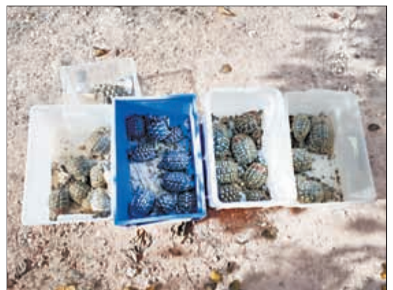
Ja s'han rescatat 172 exemplars d'aquesta espècie

Aquest projecte s'emmarca dins del Pla de Conservació de la Biodiversitat d'Endesa i es tracta d'una actuació enfocada al desenvolupament rural sostenible.