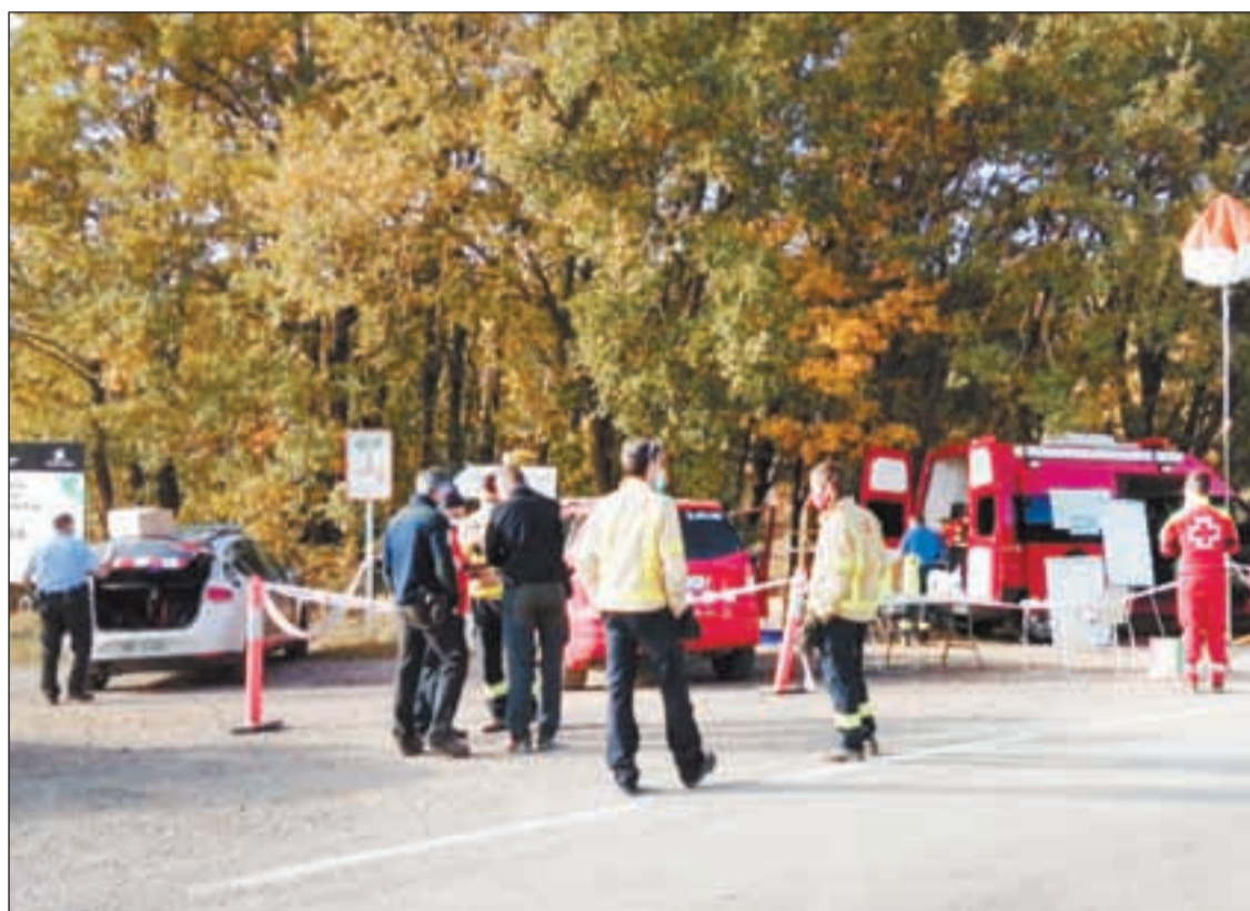
L'home es va perdre dissabte al migdia quan buscava bolets amb un amic

Els Bombers van explicar que des del seu helicòpter van detectar un objecte que podia indicar el pas recent d'algú per una zona situada a uns 2 quilòmetres del darrer punt d'albirament de la persona, i lleugerament al sud-oest dels sectors on ahir al matí