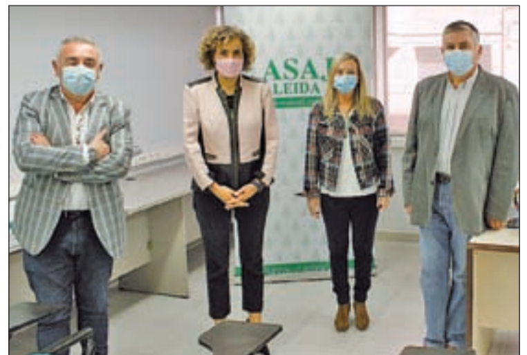
Representants d'Asaja amb Dolors Montserrat

Per la seva part, la Portaveu del PP en el Parlament Europeu, Dolors Montserrat, va assegurar que la Política Agrícola Comuna (PAC) ha de garantir que les explotacions agrícoles continuïn generant en els pròxims anys riquesa i llocs de treball. "La PAC ha de permetre que tots els europeus tinguin productes alimentaris de qualitat a un preu just, i alhora que els agricultors puguin guanyar-se la vida, que les explotacions siguin competitives i viables, que continuïn sent generadors de riquesa i d'ocupació", Va explicar Montserrat.