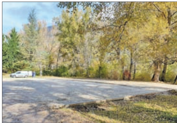
Els treballs serviran per adequar un àrea lúdica