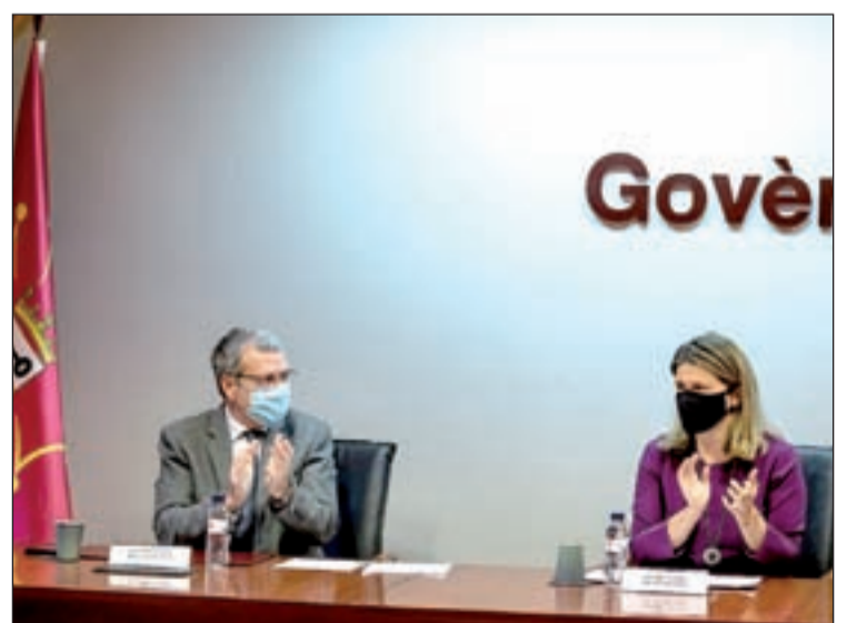
Un dels moments del nomenament de la nova síndica

Remarquen, però, que s'estan perdent animals no localitzats per espantades i que hi ha afectacions per l'estrès dels ramats i per la reducció del període de pastura a causa de la presència de l'os. Per això, reclamen als departaments d'Agricultura i Territori que també es compensin als ramaders afectats aquests danys "indirectes".