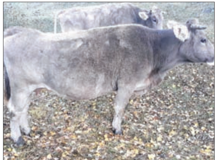
Imatge de vaques que han patit estrès a Lladorre, al Sobirà

En aquest sentit, Unió de Pagesos, amb la col·laboració de sis explotacions ramaderes del Pallars Sobirà, ha posat en marxa una prova pilot de geolocalització que permet conèixer comportaments anòmals dels ramats i, així poder determinar si han estat provocats per l'os o bé per altres causes. Unió de Pagesos denuncia que l'impacte de l'os a la ramaderia del Pirineu és més important del que els expedients de danys reflecteixen. Enguany, Ter-