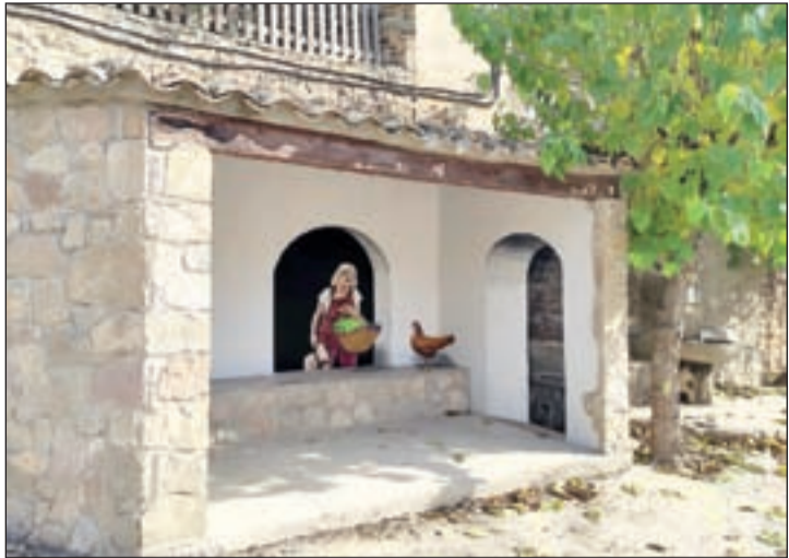
L'obra es troba a Vilanova de l'Aguda