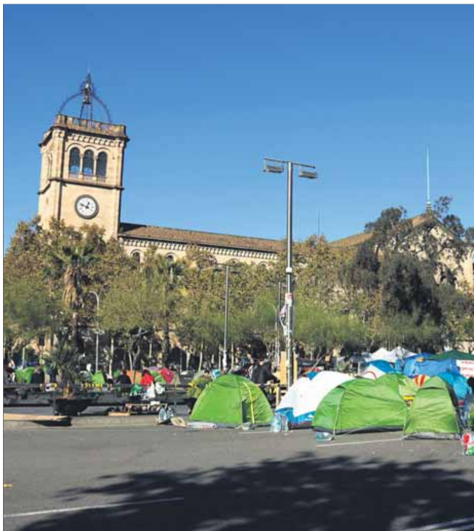
Detall de l'acampada de protesta que es va fer davant la UB per la sentència del procés