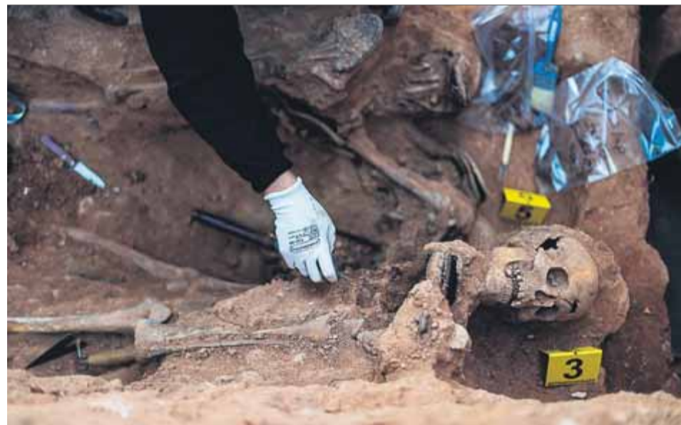
Memòria dels horrors. L'exhumació d'una fosa comú a Guadalajara és un granet de sorra en la necessària recuperació de la Memòria Històrica que el franquisme va voler esborrar.