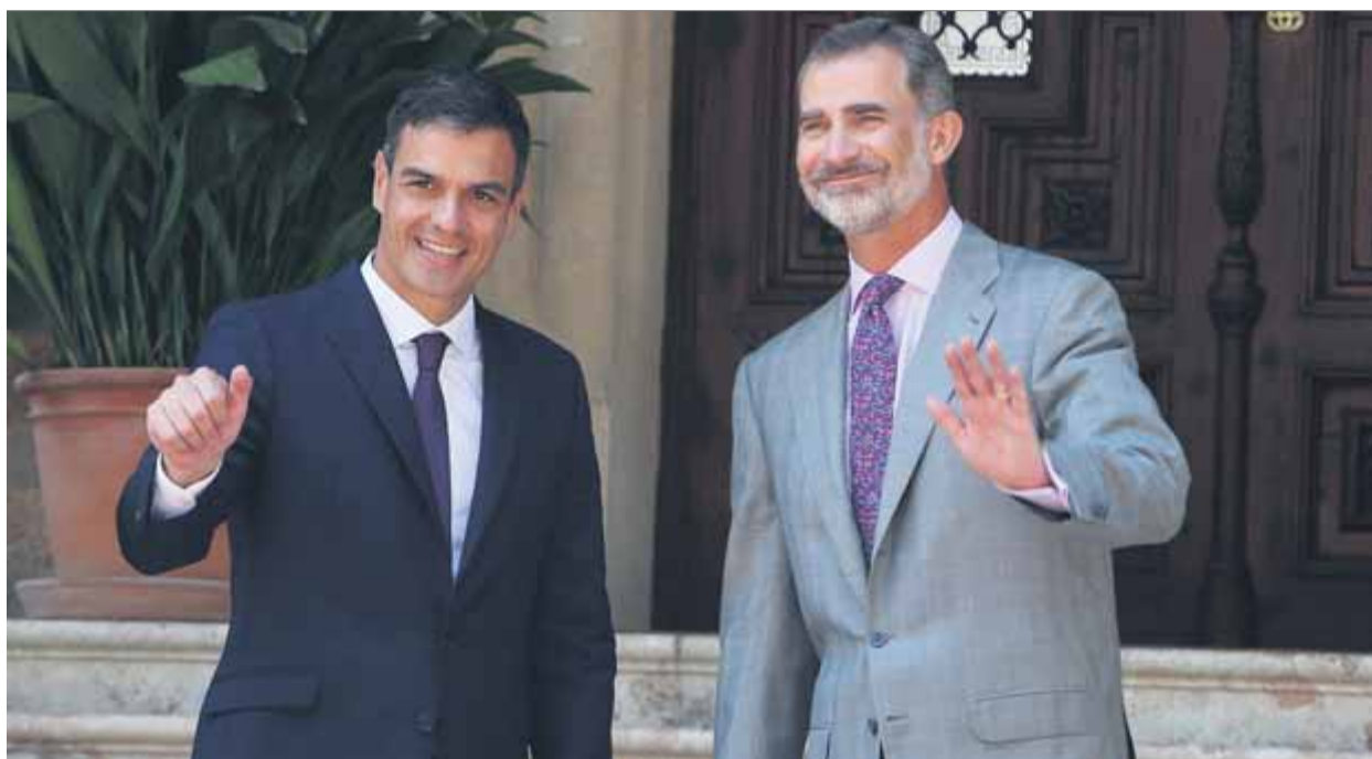
El president del govern espanyol, Pedro Sánchez, amb el rei Felip VI, al palau de Marivent, a Palma