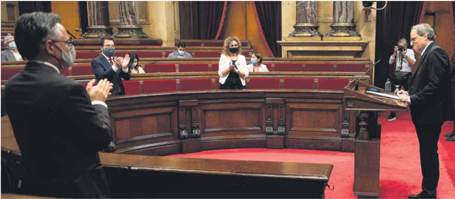
El president, Quim Torra, durant la sessió plenària del 30 de setembre passat en la qual es va pactar la resolució contra la seva inhabilitació

■ Apareix al BOPC el text aprovat per JxCat, ERC i la CUP en què li mantenen la confiança i no reconeixen la legitimitat de la sentència del TS ■ Demanen al govern una resposta antirepressiva