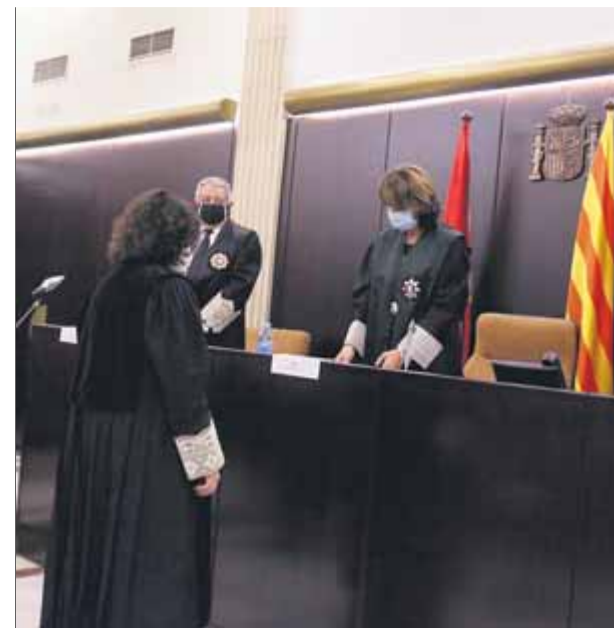
La nova fiscal de Mataró prenent possessió del càrrec davant la fiscal general de l'Estat, Dolores Delgado

Per la seva banda, des de la UB han exposat com a rèplica que estan "en espera de l'anàlisi en profunditat de la sentència", però que, tot i això, tenen intenció de presentar un recurs "davant el Tribunal Superior de Justícia de Catalunya (TSJC) reiterant els arguments en defensa de la seva actuació emparada en l'autonomia universitària". ■