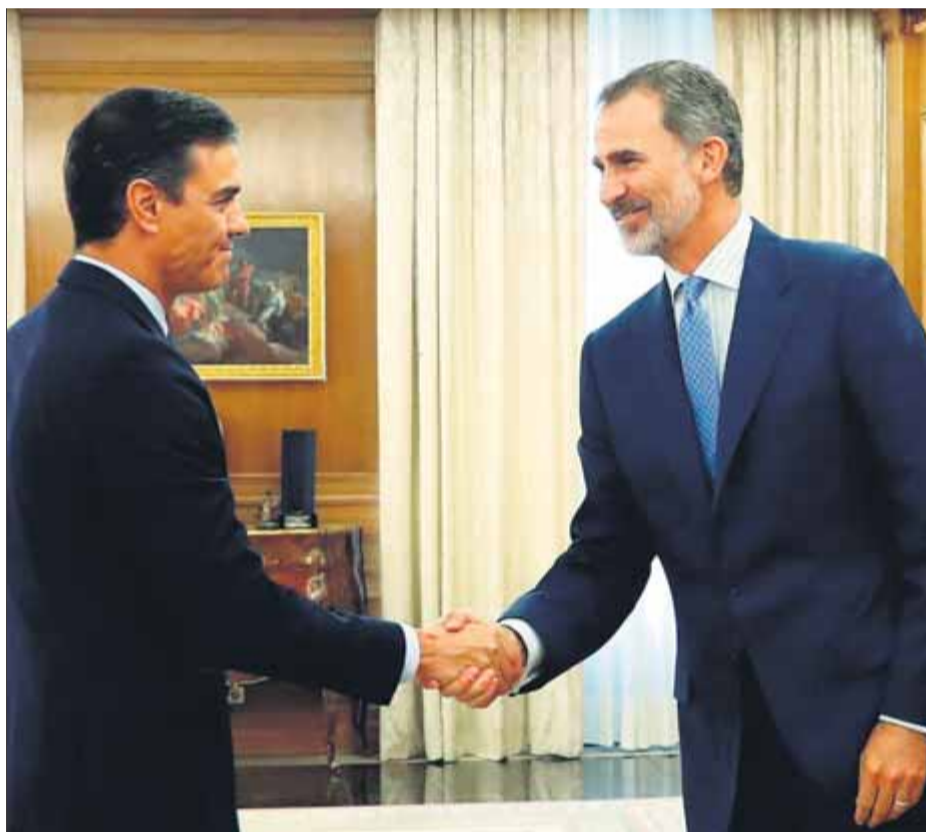
Pedro Sánchez i el rei Felip VI, en una recepció l'any passat al Palau de Miravent