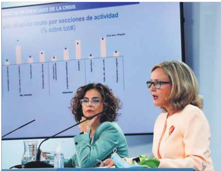
Les ministres d'Hisenda i Afers Econòmics, ahir, després del Consell de Ministres

Aquests 13.400 milions que l'administració de l'Estat preveu traspasar