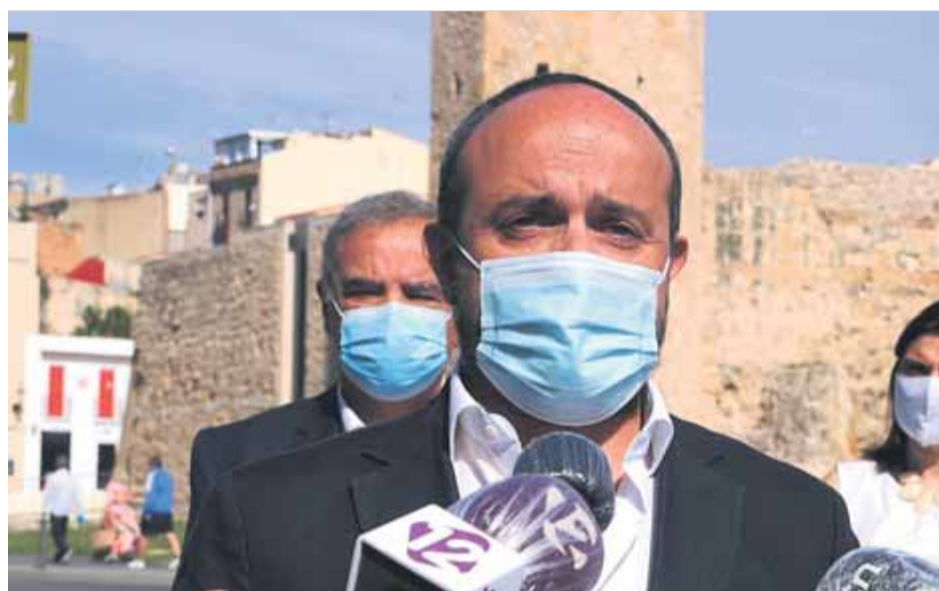
El cap de cartell de Ciutadans, Carlos Carrizosa, i el primer secretari del PSC, Miquel Iceta. A sota, la candidata dels comuns, Jéssica Albiach, i el del PP, Alejandro Fernández

Nacionalista de Catalunya, de Marta Pascal, hagi estat mai sobre la taula, "ni ho està a hores d'ara".