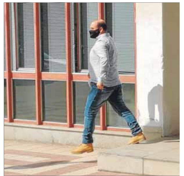
Trichin a la sortida del jutjat de Santa Coloma de Farners, on va ratificar la seva denúncia

La nit del 30 de setembre a l'1 d'octubre no vaig dormir. Ens passejàvem amb una companya per Vilafranca avisant als col·legis si veïem patrulles. Va ser una nit llarga, però hi havia molt de caliu. Abans d'obrir els col·legis vam anar a dormir una estona i, a primera hora, em vaig llevar per anar a votar. Hi ha molt bons records d'aquell dia. Tots anàvem a l'una. ■