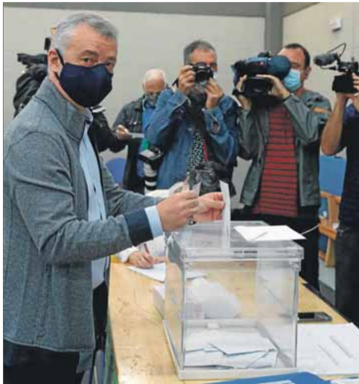
El president Iñigo Urkullu i Alberto Núñez Feijóo, del País Basc i Galícia, el dia de les eleccions, el juliol passat