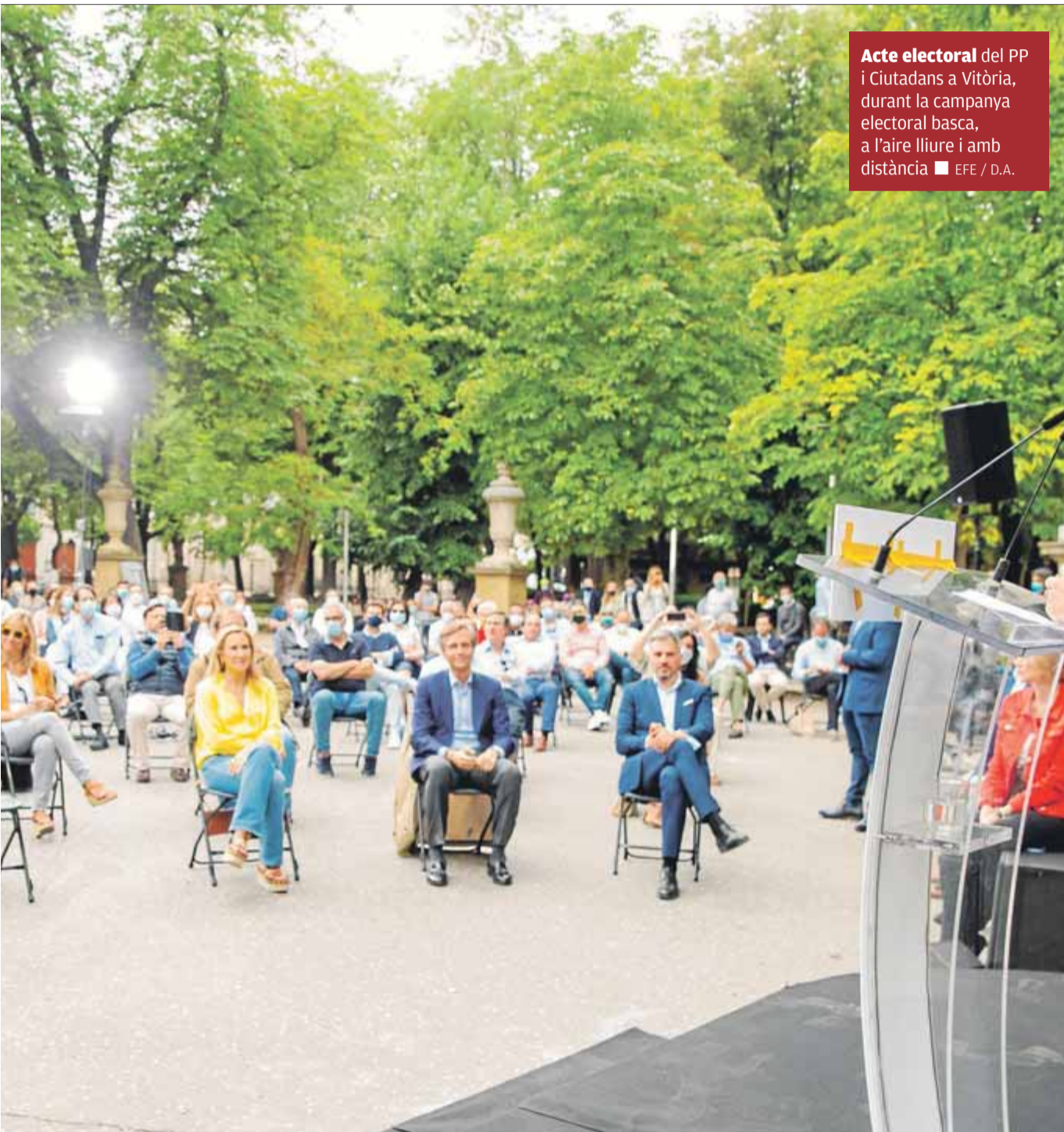
Acte electoral del PP i Ciutadans a Vitòria, durant la campanya electoral basca, a l'aire lliure i amb distància