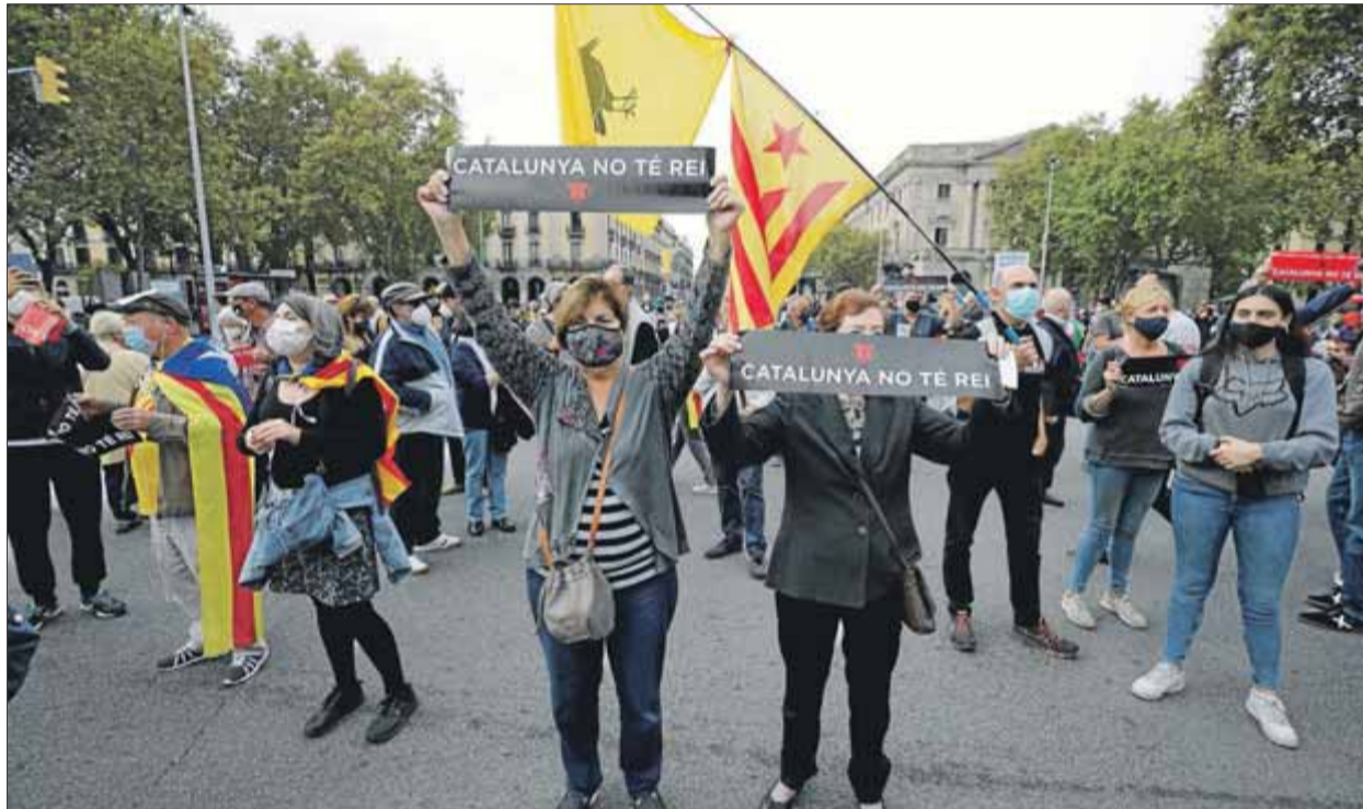
Manifestants en una de les protestes per la visita del rei Felip VI, divendres, a Barcelona

En la seva al·locució, Aragonès es va esplanar també en clau electoral so-