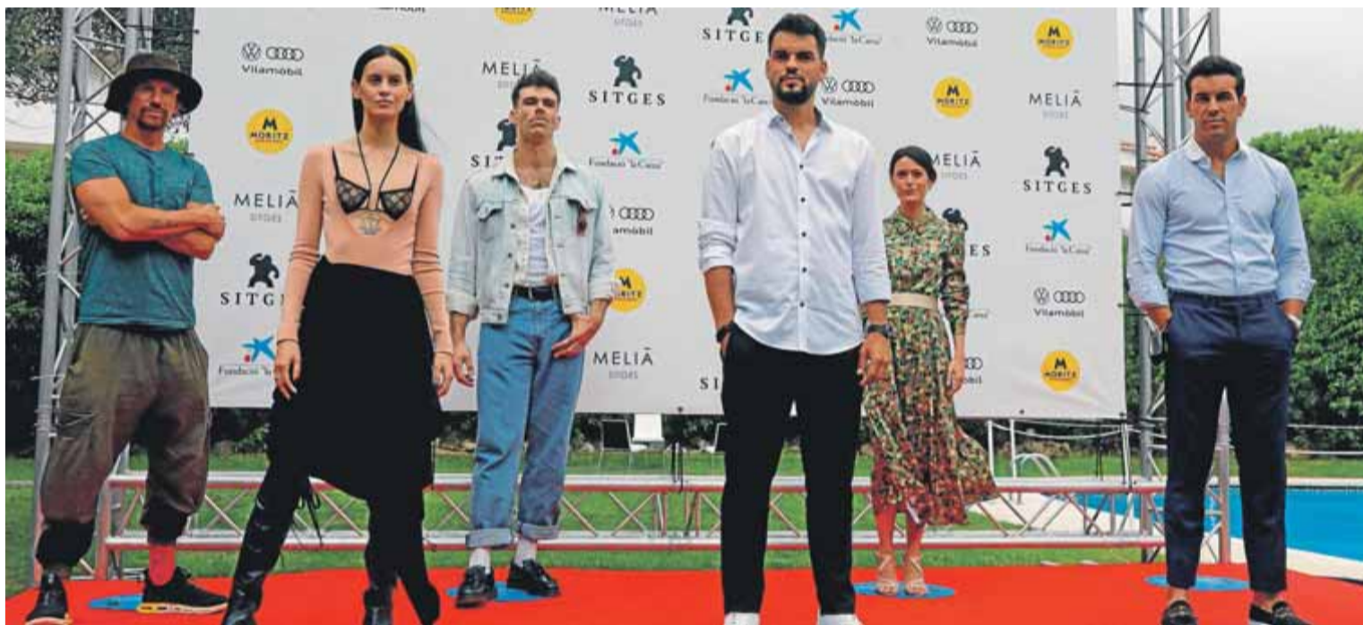
L'equip artístic de la pel·lícula 'No matarás', que es va presentar ahir, en la tercera jornada del festival

L'índex de contagi a Catalunya creix 18,5 punts en un sol dia Llocs com Puigcerdà, Matadepera i Salt superen el límit de 1.000 punts