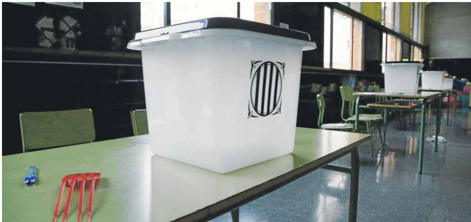
Una de les ja cèlebres urnes que es van fer servir per votar en el referèndum, el dia 1 d'octubre del 2017, abans d'obrir els col·legis electorals