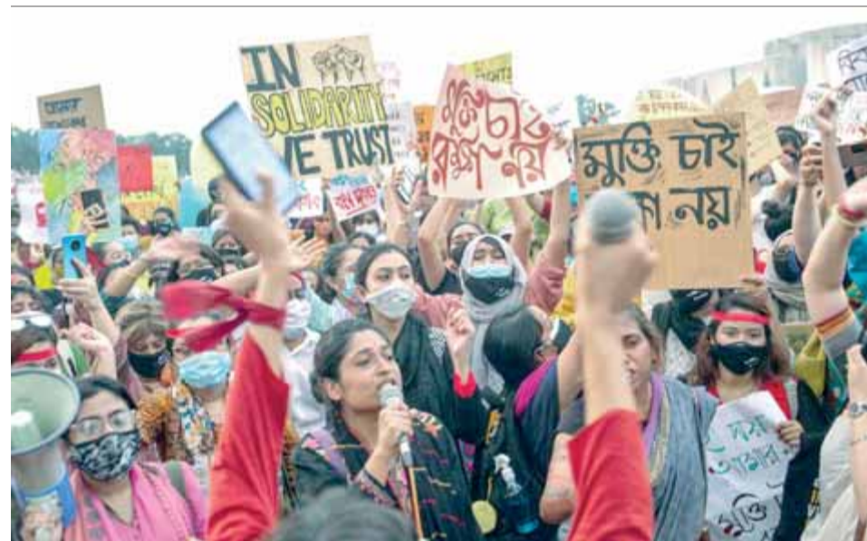
La dignitat de les dones. Activistes protesten contra les violacions i l'assetjament sexual que han de suportar a l'Índia i demanen que la violència sexista sigui declarada emergència nacional.