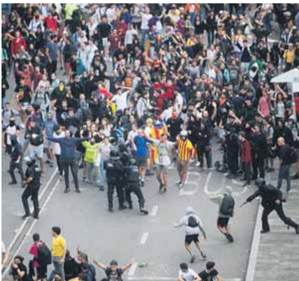
Concentració multitudinària a l'aeroport del Prat, amb càrregues policials, el 14-O passat