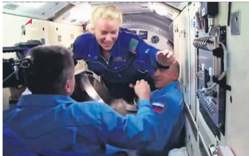
Confinats a l'espai. L'americana Rubins i els russos Rizhikov i Kud-Svertxkov van arribar ahir a l'estació espacial internacional, en una missió que els mantindrà 177 dies lluny de la Terra