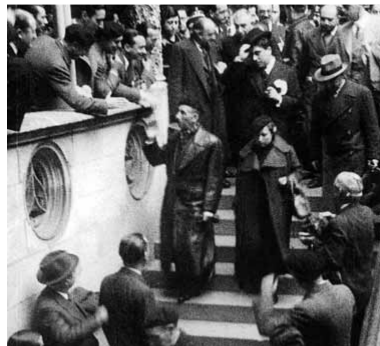
Del 14 d'abril de 1931 al 23 de gener de 1939. D'esquerra a dreta, Lluís Companys després de proclamar la República des del balcó de l'Ajuntament de Barcelona el 1931, amb el general Franco quan era ministre el 1933, després de tornar de presidir el 1936 i en el moment d'abandonar el Palau de la Generalitat el 1939 ■ ARXIU.