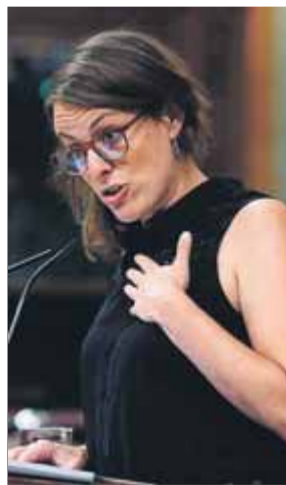
Vehí (CUP) preguntava ahir a Sánchez al Congrés

La diputada de la CUP va aprofitar un dels pocs torns que té per interrogar Sánchez en una sessió de