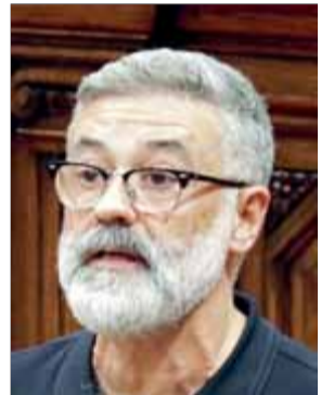
Carles Riera, diputat de la CUP ■ ACN

Riera va insistir en la necessitat que els partits i el moviment social sumin "amb totes les eines i estructures necessàries per forçar l'Estat espanyol a una resolució democràtica del conflicte polític", i va reclamar que "el 14 de