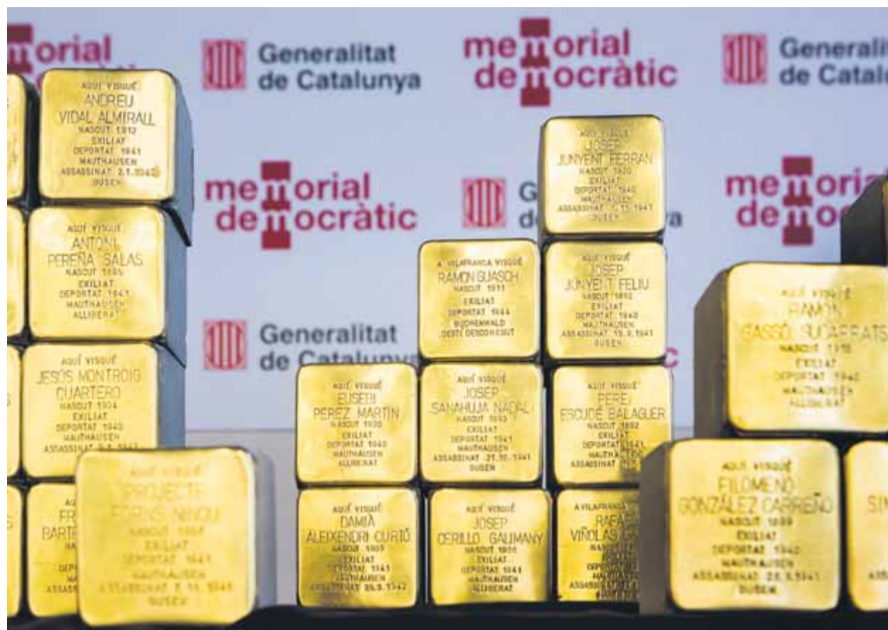
Les plaques Stolpersteine que es van col·locar ahir a Súria

persones es van exhumar a la fossa més gran oberta fins ara a Catalunya, al cementiri antic del Soleràs, a les Garrigues.