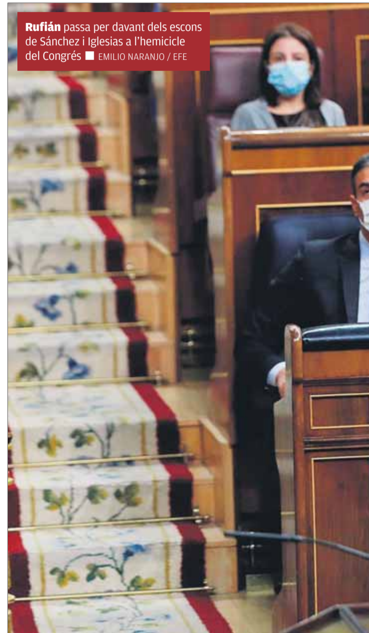
Rufián passa per davant dels escons de Sánchez i Iglesias a l'hemicicle del Congrés

La ministra d'Hisenda sí que valora i molt poder aprovar la salvaguarda constitucional per donar seguretat jurídica al pas previ a l'elaboració del pressupost. El govern de Sánchez ja va tastar un escarment dels socis amb la derrota al Congrés del decret dels romanents municipals i ara no es pot permetre un fracàs quan han passat 29 mesos des de la moció de censura del juny del 2018 que va desallotjar