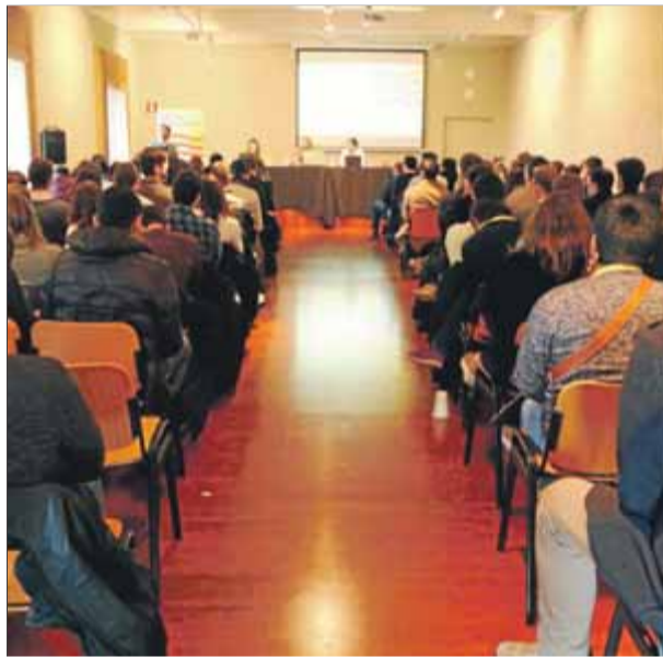
Cloenda del congrés que la JNC va fer el novembre de l'any passat al monestir de Poblet ■ ACN

"El PDeCAT ha decidit que supedita l'objectiu nacional de la independència de Catalunya a tot un seguit de condicions que nosaltres no compartim, de manera que la nostra relació no pot continuar", constaten. Expliquen que la JNC té exmilitants a la presó i a l'exili "per haver permès als catalans votar