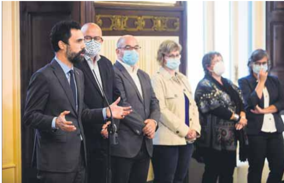
Torrent en la recepció que va fer ahir als exmembres de la mesa Coromines, Guinó, Simó i Barrufet i a l'exdiputada de la CUP Mireia Boya

El president del Parlament, Roger Torrent, va rebre ahir els quatre membres de la mesa de la passada legislatura que han estat inhabilitats pel Tribunal Superior de Justícia de Catalunya (TSJC) –Lluís Maria Coromines, Anna Simó, Ramona Barrufet i Lluís Guinó– així com l’aleshores presidenta del grup parlamentari de la CUP, Mireia Boya, en agraïment a la seva “fermesa per defensar la llibertat d’expressió del Parlament”. Acompanyat del vicepresident del govern, Pere Aragonès, i de la con-