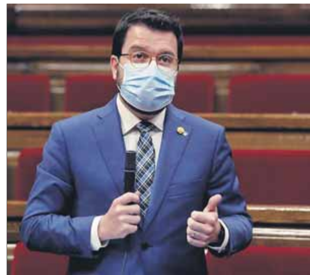
El vicepresident serà qui participarà a la conferència de presidents autonòmics de dilluns

Per part del bloc constitucionalista, Cs va insistir que els "separatistes" volen fer creure que l'única incògnita és si aconseguiran més del 50% i va lamentar que només pensen en "la meitat de la població". El president del PSC, Miquel Iceta, va allargar la mà per trobar un acord polític que permeti d'afrontar l'epidèmia i una nova legislatura. ■