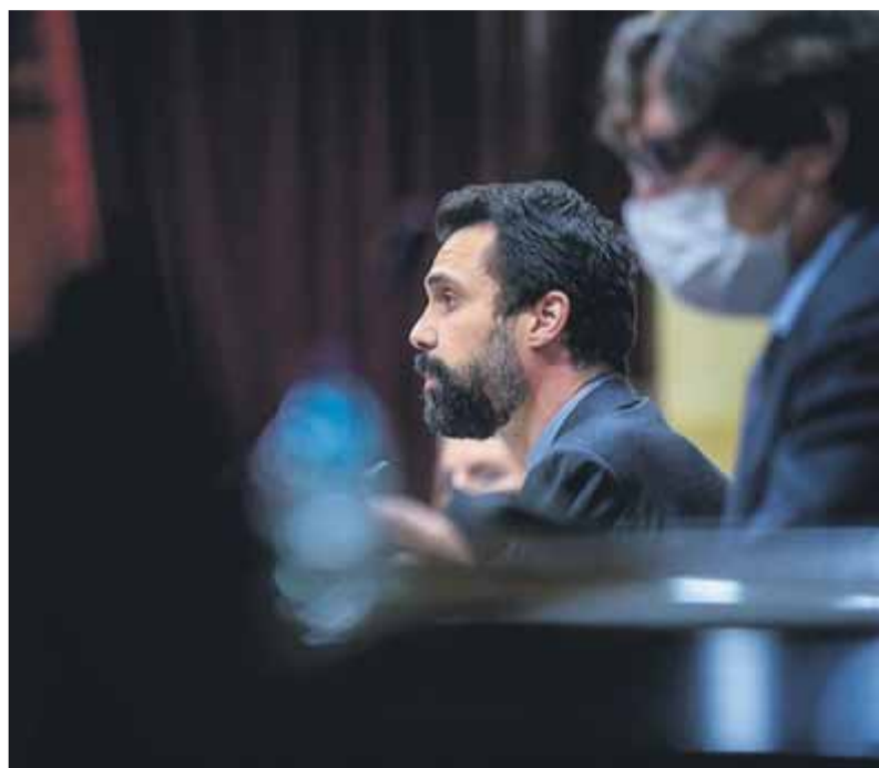
El president del Parlament ahir en el ple de la cambra en què va donar compte que no hi ha candidats i s'activa un període de dos mesos per trobar-ne un