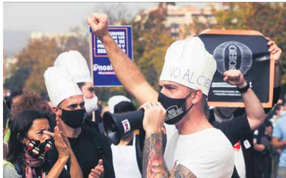
A peu de carrer. Les protestes al carrer dels sectors de l'oci nocturn i de la restauració no afluïxen i se n'hi van sumant d'altres sectors tocats per la Covid ■ ORIOL DURAN