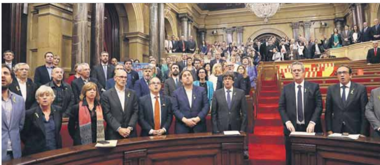
Els diputats que van quedar a l'hemicle el dia 27 d'octubre, cantant 'Els segadors'

va veure com la demanda al Parlament que es publicà al Diari Oficial de la Generalitat (DOGC) no va prosperar ni en comissió per l'absència de la CUP en les votacions.