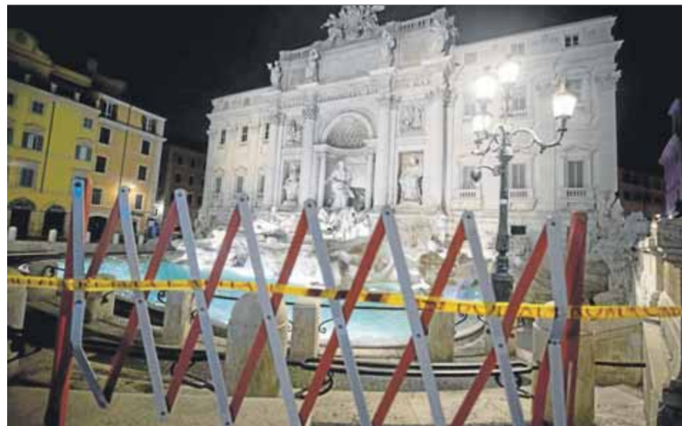
El toc de queda s'estén. L'emblemàtica Fontana de Trevi vivia confinada de dia i ara deserta de nit degut al toc de queda que el govern italià ha decretat a Roma, Milà i Nàpols ■ EFE