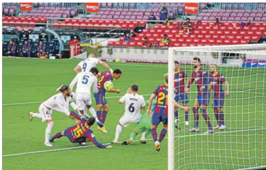
Ramos i Lenglet es disputen la posició, en una jugada del partit d'ahir al Camp Nou

El VAR torna a impulsar els blancs i els de Koeman no troben la reacció (1-3)