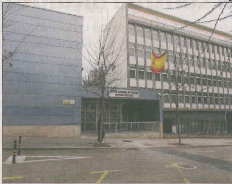
Imatge de la comissaria de la Policia Nacional a Lleida.

La dona investigada va quedar en llibertat després de declarar en seu policial. Per la seua part, l'home declararà avui a la comissaria i està previst que demà passi a disposició del jutjat de guàrdia. Estan investigats per la presumpta comissió dels delictes de tràfic d'éssers humans amb finalitats d'explotació sexual i pertinença a organització criminal. Els investigadors sospiten que els dos arrestats formen part d'una xarxa que forçava dones a prostituir-se. Entre altres proves, tindrien converses telefòniques i el testimoni de diverses víctimes. No va transcendir si hi ha hagut altres detinguts relacionats amb aquesta operació, que continua