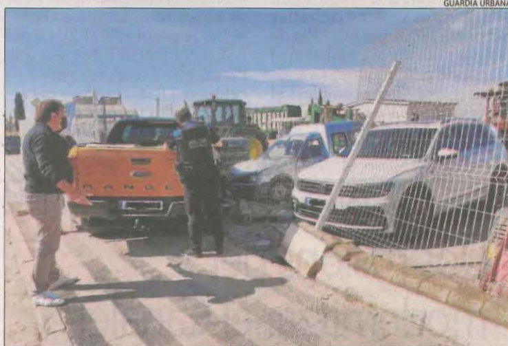
L'accident es va produir ahir al migdia al carrer Major de Sucs.