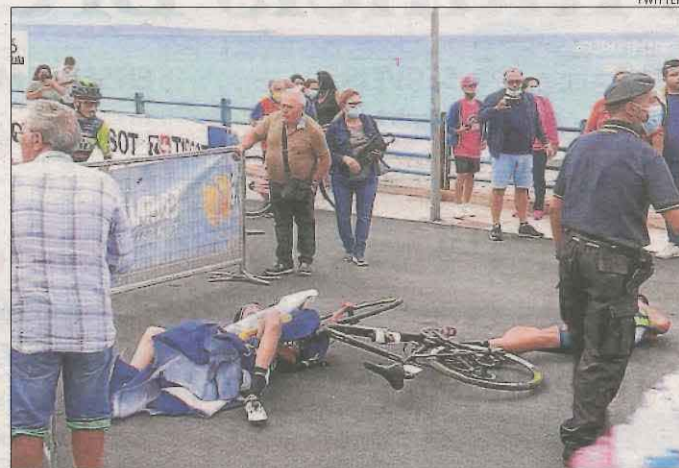
Els dos corredors, a terra després de l'incident.