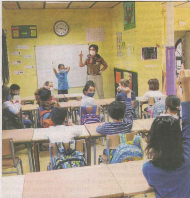
Una aula de l'escola de Saldú a l'inici del curs.