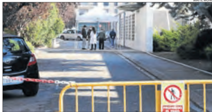
Imatge de la carpa al CAP de Balàfia-Pardinyes.

"S'han arribat als màxims històrics i el passat dia 15 gairebé se'n van fer 2.500. El laboratori està fent un esforç titànic", van assenyalar fonts del departament de Salut, que van afegir que "esperem que els tests ràpids d'antígens puguin reduir aquesta pressió". En aquest sentit, van explicar que el professional sanitari és