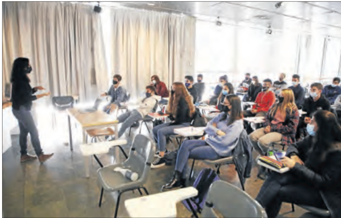
Una classe presencial a la facultat d'Educació de la UdL.

D'aquesta manera, tota la docència de la UdL passarà a ser telemàtica, com ja va passar durant el confinament del mes de març. La majoria de les classes presencials de la UdL es van suspendre el passat dia 12 d'octubre després que la Generalitat recomanés fer-les virtuals durant, com a mínim, quinze dies.