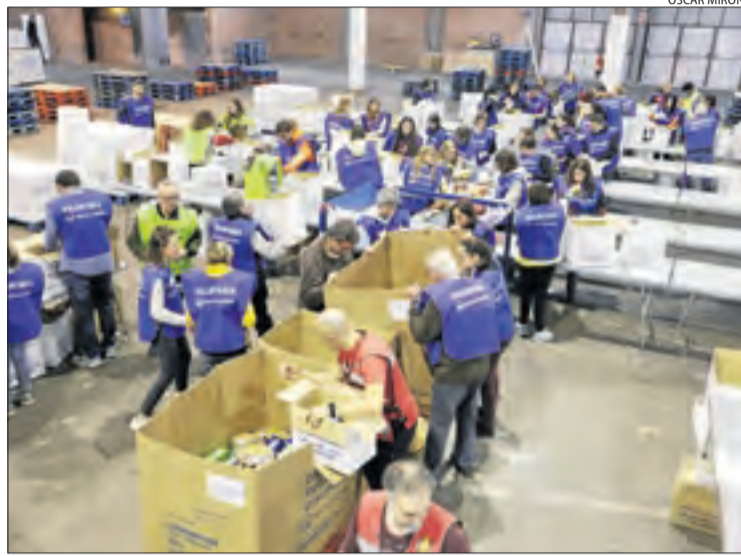
Imatge d'arxiu de voluntaris classificant aliments.