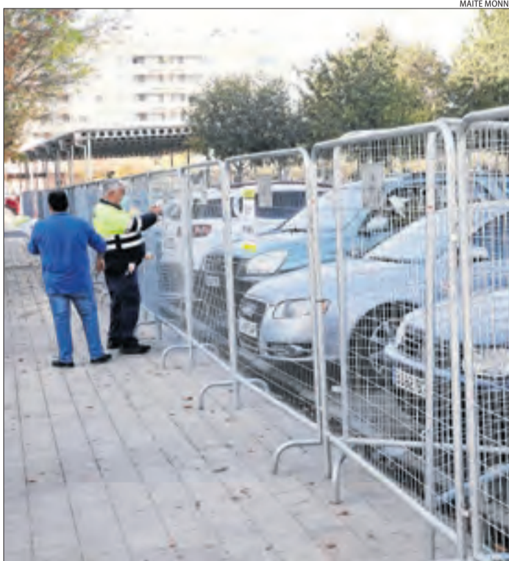
Tanques al mercadillo per controlar l'aforament ■ L'ajuntament de Lleida ha tancat el recinte del pàrquing del Barris Nord per controlar l'aforament al mercadillo que se celebra avui. La Paeria va avisar que si no es respecten els controls, el suspèn.

Es repartiran quatre milions d'euros, aportats per la Generalitat, amb l'objectiu d'ajudar al manteniment del teixit econòmic i pal·liar, en part, les pèrdues econòmiques que van patir aquests negocis com a conseqüència del confinament del mes de juliol. El ple també va aprovar les bases dels ajuts per a ajuntaments i entitats sense ànim de lucre del Segrià per a projectes de suport en relació amb l'impacte social de la pandèmia. Es repartiran 35.850 euros.