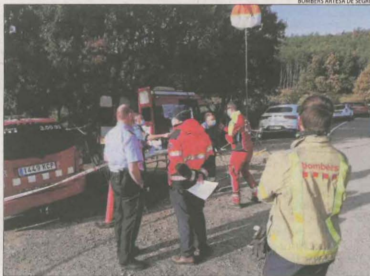
El dispositiu de recerca que va treballar durant tota la nit i en el qual van participar diversos efectius dels cossos de seguretat.