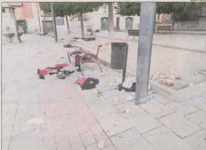
Restes del mercadillo de la plaça del Dipòsit.

Precisament, l'entitat del Barri Antic Som Veïns també va criticar la brutícia a la plaça del Dipòsit, "com a conseqüència del mercadillo il·legal que s'hi fa des de fa un any".