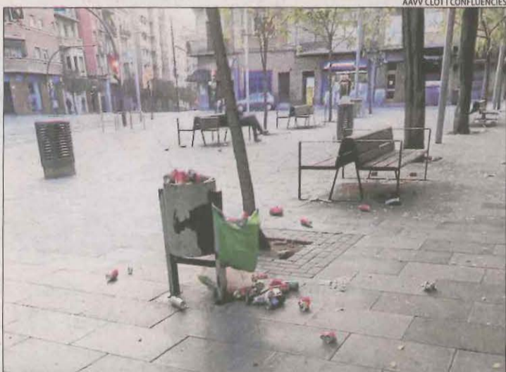
Estat de la plaça del Treball a primera hora d'ahir.