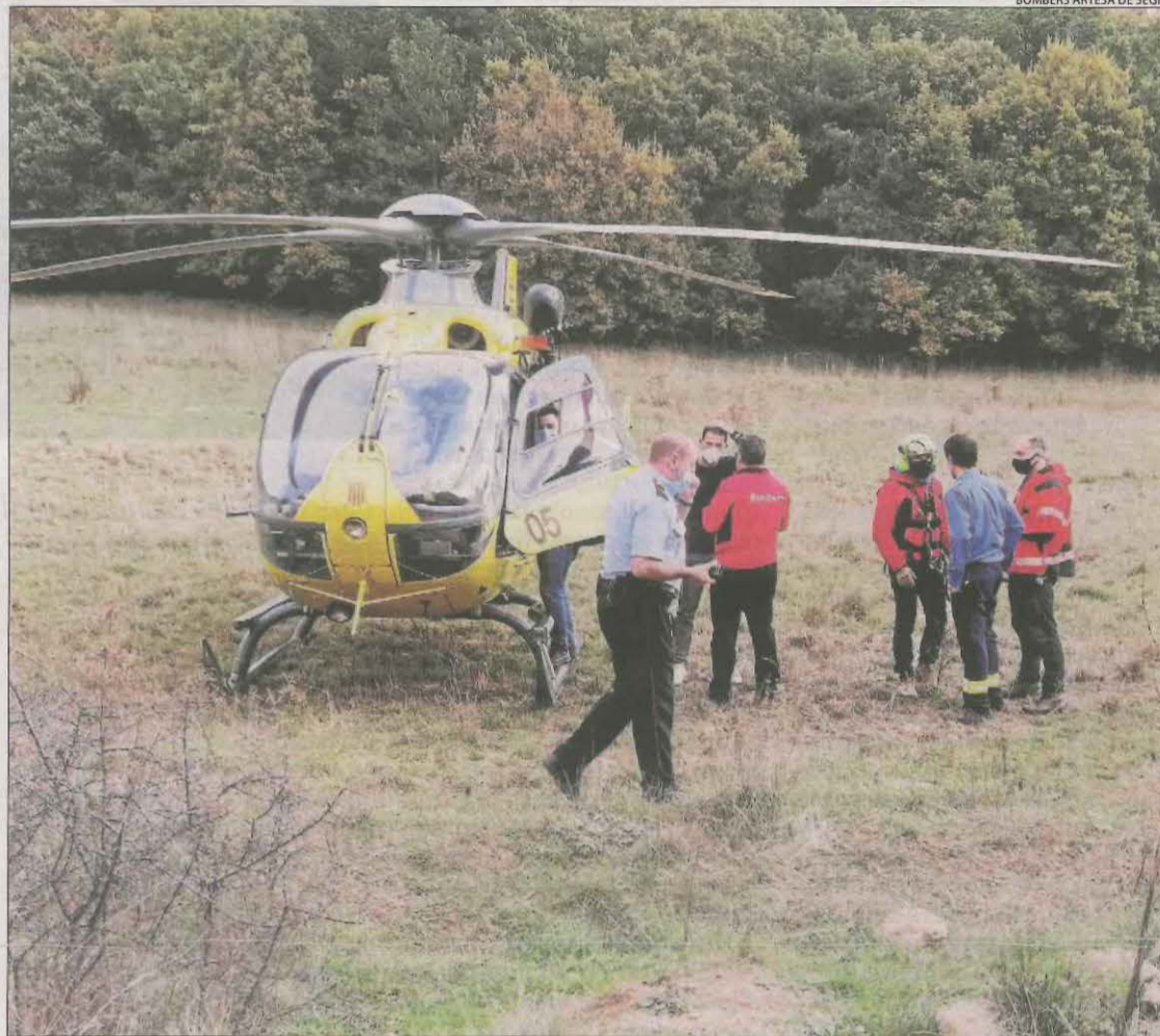
L'helicòpter dels Bombers que va traslladar el veí de Lleida fins a l'hospital de Tremp.

Així mateix, es van activar set patrulles dels Mossos d'Esquadra, amb un helicòpter, la