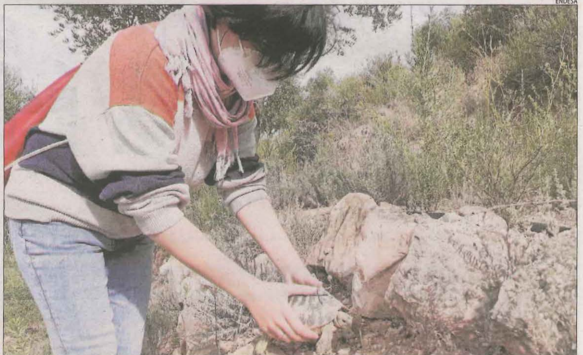
El moment en què un membre de Trenca allibera una de les tortugues mediterrànies.

El projecte de recuperació d'aquesta espècie compta amb la col·laboració de l'elèctrica Endesa