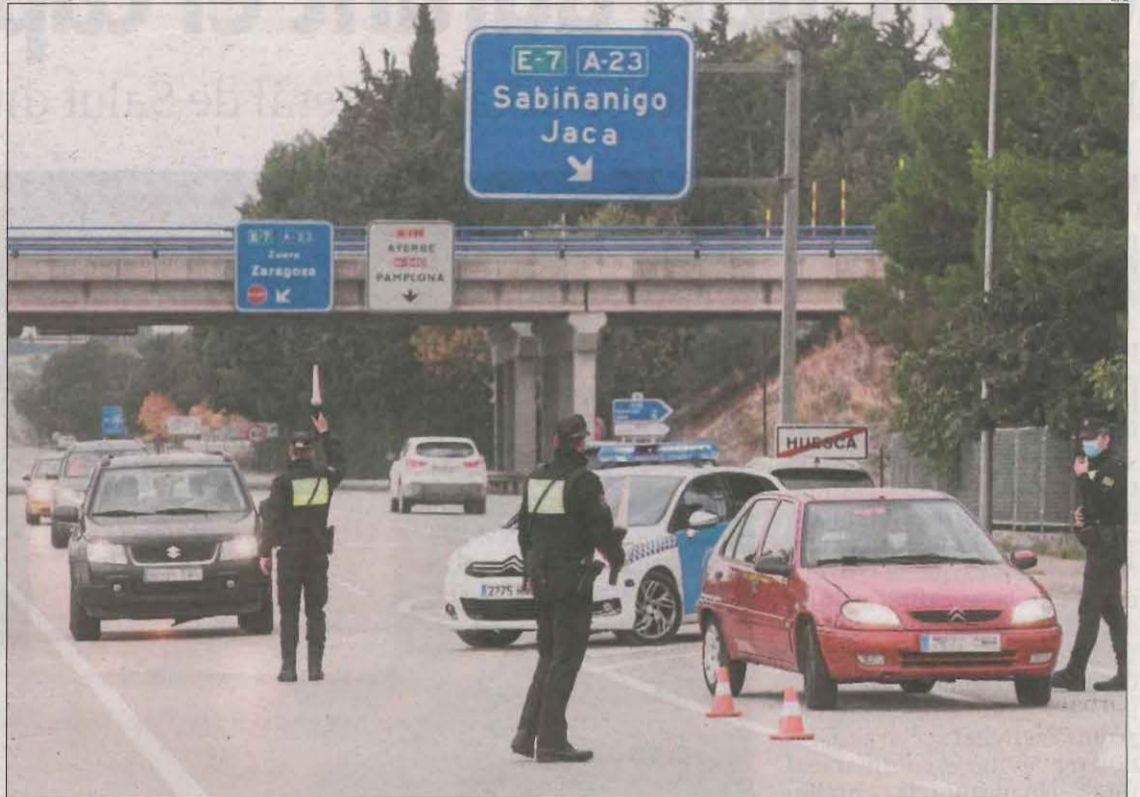
Imatge de controls la setmana passada a Osca, on vigeix un confinament perimetral.