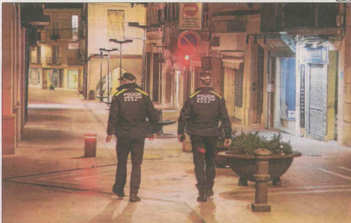
La Guàrdia Urbana de Tàrraga, controlant ahir a la nit el compliment del toc de queda.