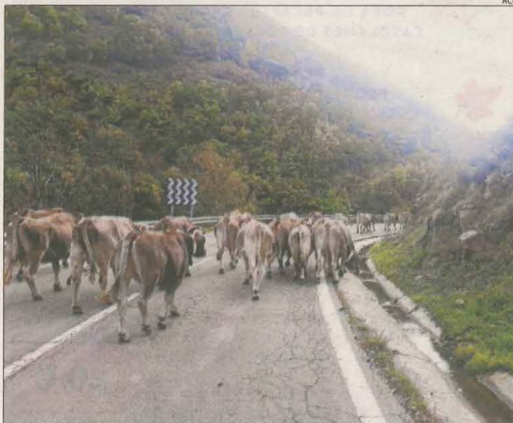
Imatge de vaques baixant de la muntanya a Lladorre.

abans del previst. Els afectats van assenyalar que els animals van abandonar les pastures d'altura un mes abans. La situació es va agreujar des de la segona quinzena de setembre, quan el bestiar boví intentava abandonar les zones baixes de pastura. Denuncien que aquesta situació coincideix amb l'aparició d'animals ferits, així com una vaca morta amb "signes evidents de la presència de l'ós" i una altra de desapareguda.