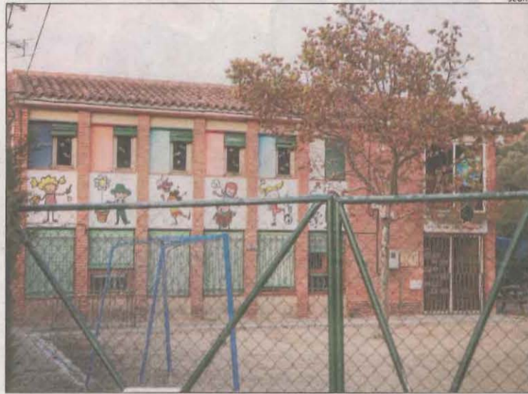
Imatge de l'escola Maldanell de Maldà, que té 12 alumnes.

Segons dades d'Educació, a tota la província hi ha 116 classes aïllades, davant de les 103 del dia anterior, amb més de 2.800 persones. Malgrat l'increment, els estudiants i el personal educatiu confinats suposen tan sols al voltant d'un 4% del total. El Segrià guanya nou classes confinades i ja en