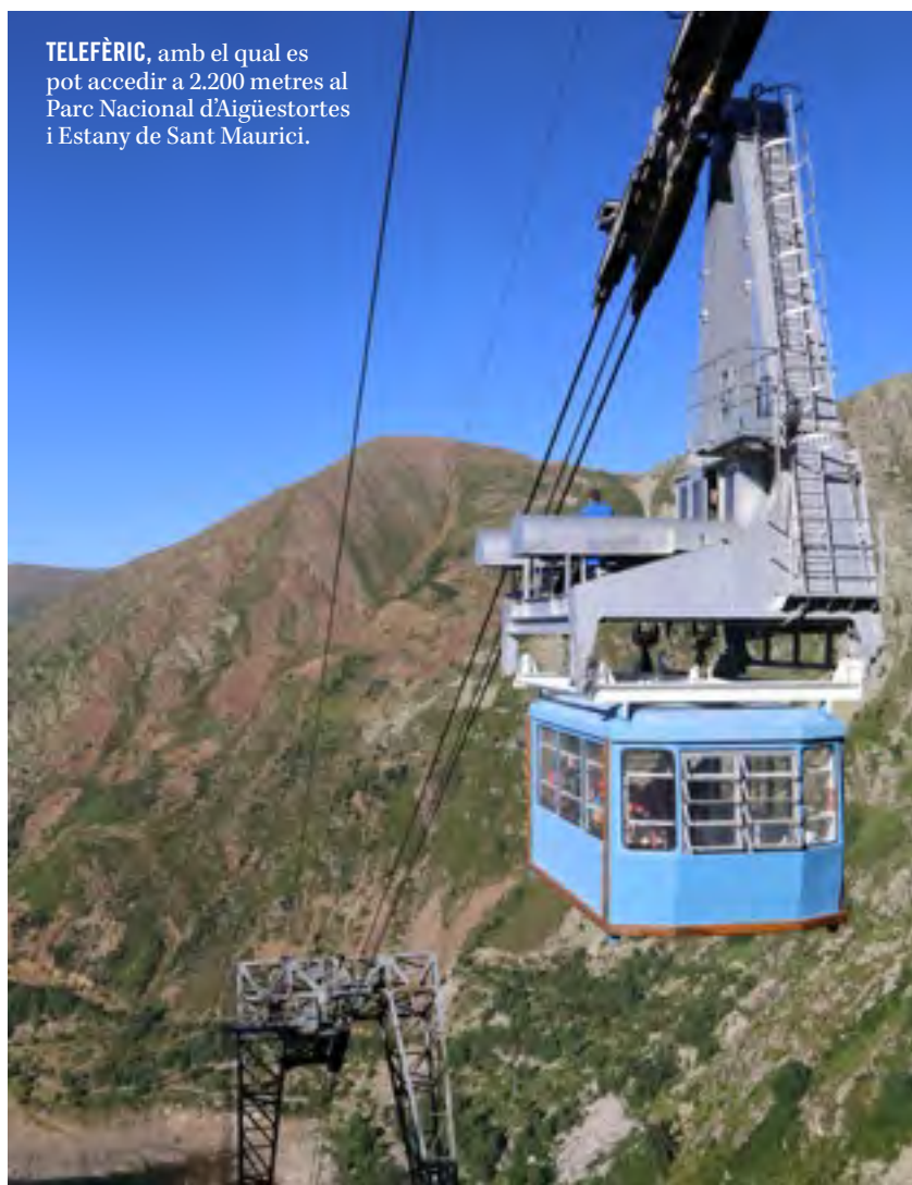
TELEFÈRIC, amb el qual es pot accedir a 2.200 metres al Parc Nacional d'Aigüestortes i Estany de Sant Maurici.

l'hospital de cartró, que ha aguantat durant un segle –va ser instal·lat el 1913– les inclemències meteorològiques i l'abandó. Era l'hospital de la Central de Capdella, edificat de plafons de cartró per l'empresa alemanya Christoph&Unmack, i no és estrany que encara avui en dia el vulguin veure i estudiar amants i estudiosos de l'arquitectura prefabricada. De fet, ara està immers en un procés participatiu amb els veïns per decidir quin ús se li dona. Un dels altres elements icònics de la Vall Fosca és, sens dubte, el telefèric Vall Fosca, que permet accedir, fins a 2.200 metres, a l'Estany Gento, i per tant, arribar al Parc Nacional d'Aigüestortes i Estany de Sant Maurici, des d'on es poden iniciar un bon nombre de visites guiades per tot el parc i els seus 32 estanys, així com els 5 quilòmetres de ruta de la via verda del Carrilet, aptes per fer en família ja que no té desnivells i permet recórrer les vies que servien per transportar materials, en alguns moments a través de túnels, cosa que s'acaba convertint