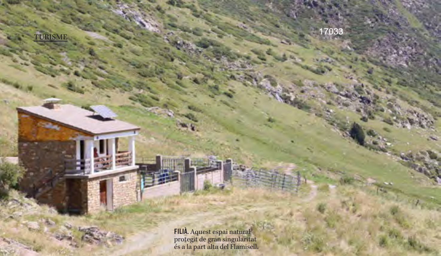
FILIÀ. Aquest espai natural protegit de gran singularitat és a la part alta del Flamisell.

l'hospital de cartró, que ha aguantat durant un segle –va ser instal·lat el 1913– les inclemències meteorològiques i l'abandó. Era l'hospital de la Central de Capdella, edificat de plafons de cartró per l'empresa alemanya Christoph&Unmack, i no és estrany que encara avui en dia el vulguin veure i estudiar amants i estudiosos de l'arquitectura prefabricada. De fet, ara està immers en un procés participatiu amb els veïns per decidir quin ús se li dona. Un dels altres elements icònics de la Vall Fosca és, sens dubte, el telefèric Vall Fosca, que permet accedir, fins a 2.200 metres, a l'Estany Gento, i per tant, arribar al Parc Nacional d'Aigüestortes i Estany de Sant Maurici, des d'on es poden iniciar un bon nombre de visites guiades per tot el parc i els seus 32 estanys, així com els 5 quilòmetres de ruta de la via verda del Carrilet, aptes per fer en família ja que no té desnivells i permet recórrer les vies que servien per transportar materials, en alguns moments a través de túnels, cosa que s'acaba convertint