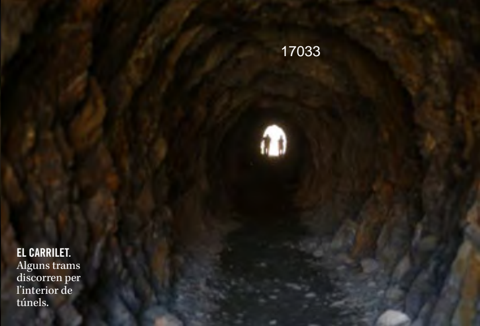
EL CARRILET. Alguns trams discorren per l'interior de túnels.