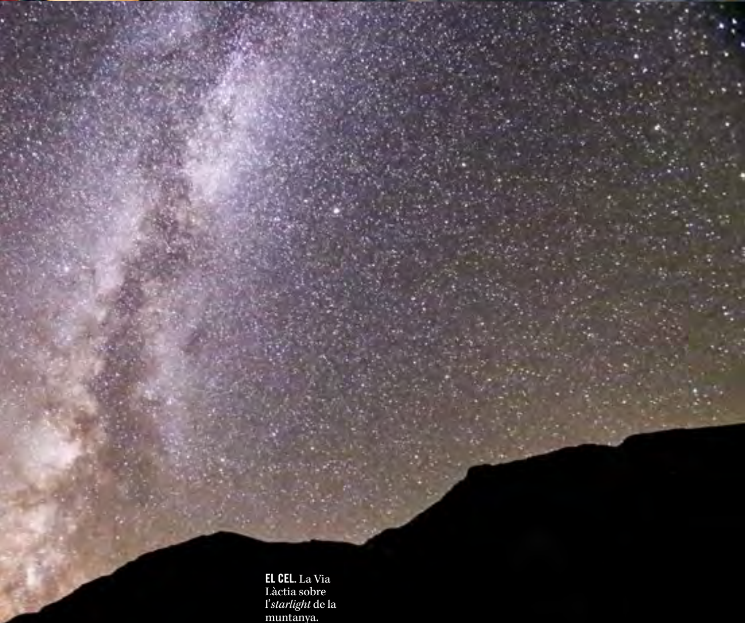
EL CEL. La Via Làctia sobre l' starlight de la muntanya.