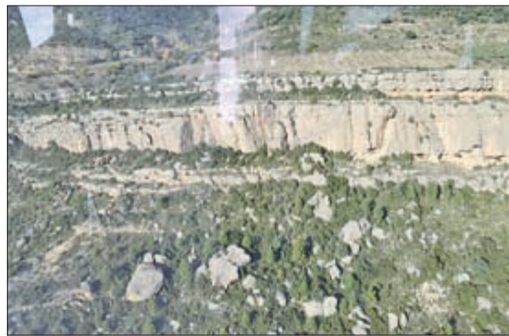
FOTO: Bombers / Zona on l'escaladora ferida greu va patir l'accident

la Pobla de Segur (Pallars Jussà). Efectius dels Bombers, amb una dotació terrestre i un altra d'aèria amb membres del GRAE, van fer la primera assistència a l'afectada i la van evacuar amb l'helicòpter fins a la Pobla de Segur. El SEM la va traslladar a l'hospital, amb un pronòstic de fractura de peu i politraumatismes.