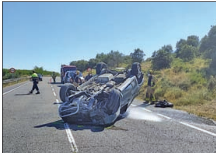
Imatge d'un accident mortal a la Sentiu de Sió al juliol

La demarcació de Lleida va registrar, entre l'1 de gener i el 31 d'octubre, un descens de víctimes mortals del 40,7% respecte el 2019 a les carreteres lleidatanes. En aquest sentit, enguany hi ha hagut 16 morts, mentre que l'any passat la xifra es va elevar a 27 durant el mateix període de temps. En comparació amb 2010, any de referència per al compliment dels objectius europeus, la reducció és del 51,5%, ja que fa 10 anys es van registrar 33 morts en accidents, segons les dades facilitades ahir pel Servei Català de Trànsit (SCT). Així mateix, cal destacar que durant el mes d'octubre cap persona va perdre la vida en un sinistre de trànsit a la província de Lleida. Pel que fa a col·lectius vulnerables, fins al 31 d'octubre, van morir dos motoristes, cap ciclista i un vianant, mentre que en el mateix període de l'any