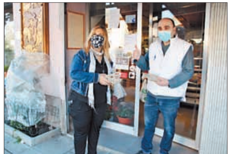
L'alcaldesa de Vilaller repartint els lots als veïns

Tot i que no es va poder celebrar com és habitual, l'Ajuntament de Vilaller volia mantenir l'esperit de la Fira de Tots Sants del 2 de novembre. Per això, ahir va repartir un lot de Fira per cada casa i a cada lot hi havia torrons tradicionals de fira, una esquella de clauer i una carta de la baralla per poder jugar al joc tradicional del Catxo de fira. Es va fer online el Joc del Catxo amb premi d'un lot de torrons artesans i productes de proximitat i es va difondre un vídeo amb imatges i intervencions amb el lema "Moments de Fira". Finalment es va realitzar la 34 edició del Concurs De Bestiar, amb format virtual i en el que