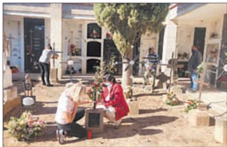
S'han omplert 20 nínxols i unes 60 tombes