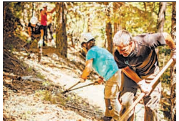
És una activitat que l'organitza el Projecte Boscos

La millora d'hàbitat s'ha fet per condicionar el bosc per al futur, reforçant-lo com a ecosistema estable i sostenible, garantint