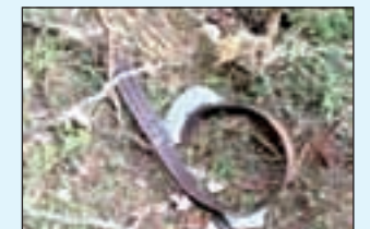
El collar va ser trobat dimarts

El collar GPS que geolocalitzava l'os Goiat via satèl·lit es va localitzar dimarts a la Ribagorça aragonesa. Després de quinze dies sense captar cap moviment, personal tècnic es va desplaçar fins a la zona del registre de l'últim senyal i va recuperar el dispositiu. Es creu que Goiat va perdre el collar el 15 d'octubre. El dispositiu, que es troba en bones condicions, permetrà recuperar localitzacions no enviades i dades d'activitat de l'exemplar dels darrers dos anys, segons Territori i Sostenibilitat. Goiat serà identificable per les marques auriculars que porta.