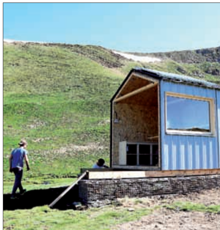
Imatge d'arxiu de la cabana de pastor a mig construir

En total, s'han registrat 16 arnes danyades per os bru, 15 de les quals en zona de presència permanent d'os bru i sense protegir. També s'han produït danys a dos cabres i set ovelles en zona permanent d'os. Entre aquestes, 6 ovelles dels agrupaments que han quedat aïllades i fora dels tancats de protecció nocturns dels agrupaments. A més, altres sol·licituds continuen encara en