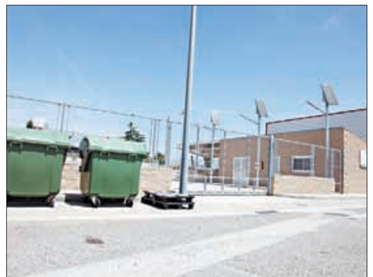
Imatge de la deixalleria que es demana ampliar

blicà va ubicar a Foradada una línia de defensa per retenir les tropes rebels, que avançaven cap a Artesa de Segre. Els combats van ser d'una extrema duresa, amb nombroses víctimes. Els sollevats van aconseguir trencar la línia defensiva el 4 de gener del 1939 i van continuar conquerint el territori.