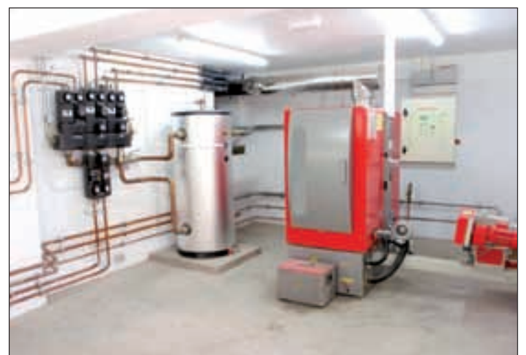
L'operació està gestionada pel Promoció Econòmica

Els 13 sistemes de calefacció licitats tenen una potència tèrmica de 1.500 Kw i calefacteran, a partir d'estella dels boscos públics del Pirineu, diversos edificis i equipaments de Bassella, Bellver