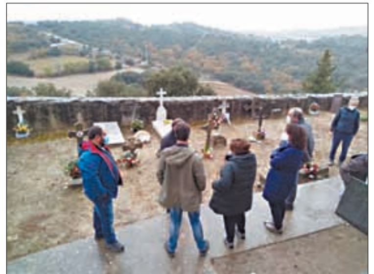
L'enterrament que s'ha fet als soldats republicans

Els arqueòlegs van trobar les restes d'un dels individus durant l'obertura d'una fossa ubicada a la carena de la Serra Alta, al setembre del 2019. És un soldat