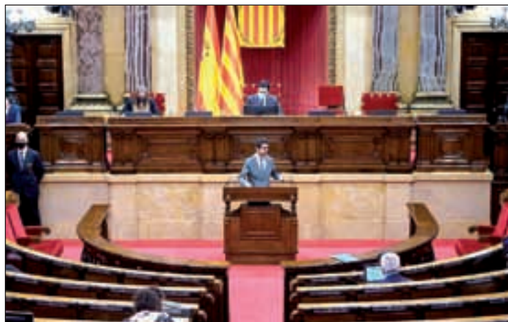
El conseller Damià Calvet va presentar el pla al Parlament

Aquesta iniciativa, que vol lluitar contra el despoblament, comptarà amb una prova pilot dotada amb dos milions d'euros que es destinaran a ajudes per rehabilitar aquests habitatges