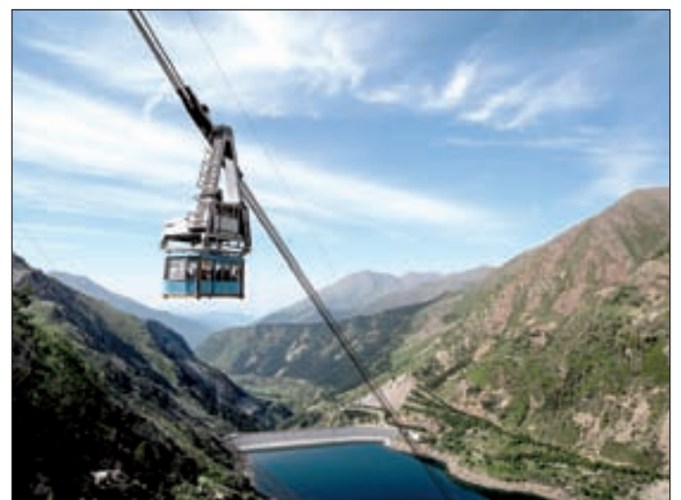
Telefèric d'Estany Gento, al Pallars Jussà

ha sigut obligatori l'ús de la mascareta, rentat de mans amb gel hidroalcohòlic en entrar i sortir del telefèric, ventilació interior natural, i desinfecció de la cabina després de cada trajecte. El telefèric va ser construït l'any 1981 per l'antiga Fecsa per substituir l'antic sistema d'accés a l'estany (dos funiculars i un ferrocarril de via estreta) i facilitar el trans-