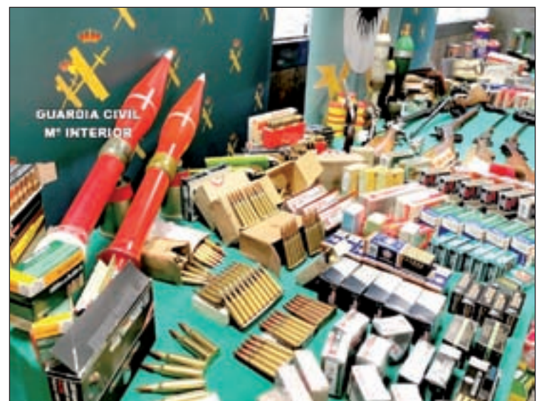
Part de la municions interceptada per la policia

Investigacions posteriors van posar de manifest que el principal objectiu, resident a Madrid, feia més de cinc anys que venia il·legalment municions, majoritàriament a persones que tenien armes de foc il·legalment i no poden adquirir-la en establiments autoritzats. Des de llavors hauria venut més de 36.000 cartutxos metàl·lics de diferents calibres, tant per a armes curtes com llargues, inclosa municions de guerra. Per tal de fabricar part de la municions disposava d'un taller clandestí on, a més de 18.000 cartutxos ja elaborats, es van intervenir 100 kilograms de projectils, baines, encebadors i pólvora, així com de la maquinària i eines necessàries per a la fabricació artesanal de cartutxeria metàl·lica de 30 calibres diferents, que més