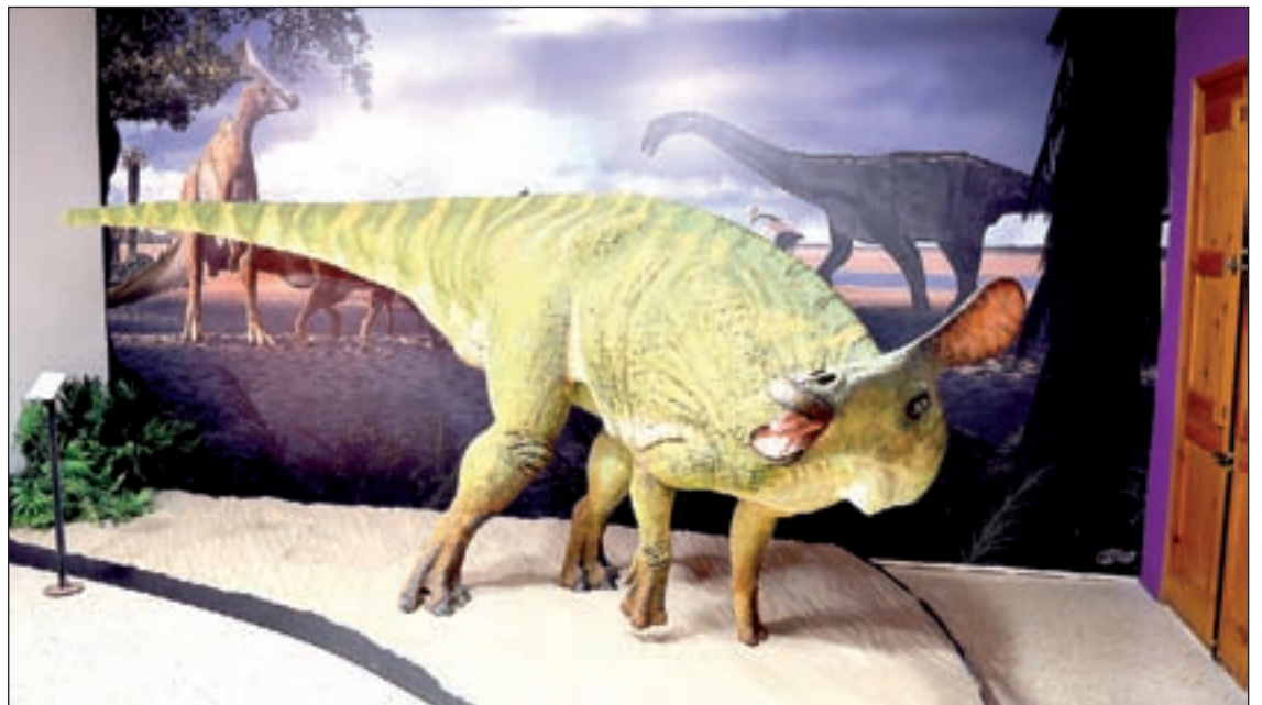
Els dinosaures dels Pirineus van ser els darrers que van viure a Europa

Fins ara, la posició de P. isonensis dins del grup dels hadrosàurids era bastant ambigua a causa de les poques restes disponibles. L'estudi també aporta nova llum. "Les noves dades donen suport a la hipòtesi que el lambeosauri d'Isona està molt relacionat amb Tsintaosaurus spinorhinus , una espècie més antiga descrita a la Xina als anys 50", va explicar Prieto-Márquez.