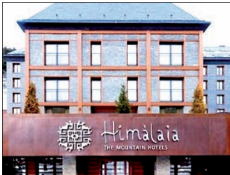
Hi haurà 141 habitacions amb capacitat per a 5 persones

En el catàleg d'habitacions destaquen les dúplexs, la suites i júnior suites, totes elles inspirades en una decoració d'alta muntanya i amb vista a la vall. Així mateix, l'hotel compta amb un spa