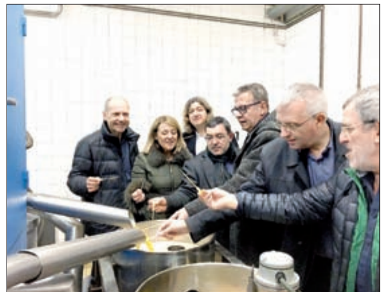
Imatge de l'edició anterior de la Fira de l'Oli Verd de Maials