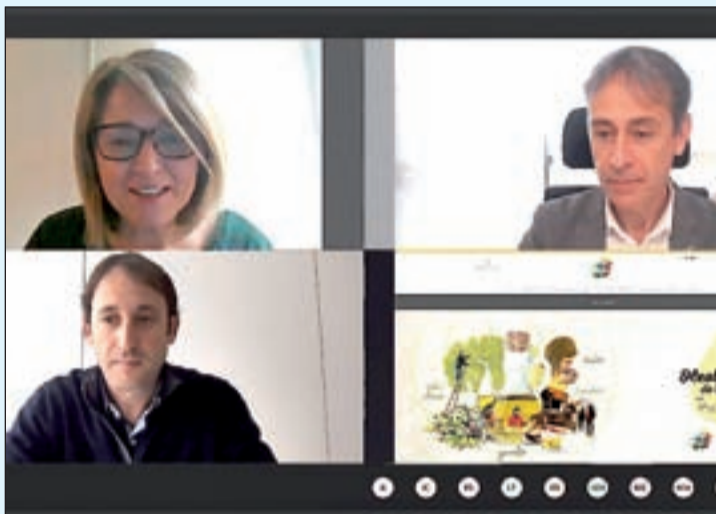
La presentació es va fer virtualment

El pla de promoció del producte 'Oleoturisme de Lleida. El gust de la terra', presentat ahir pel Patronat de Turisme de la Diputació, inclou, de moment, 38 experiències oleoturístiques per gaudir-ne a les comarques de les Garrigues, la Noguera, el Segrià, l'Urgell i el Pallars Jussà .