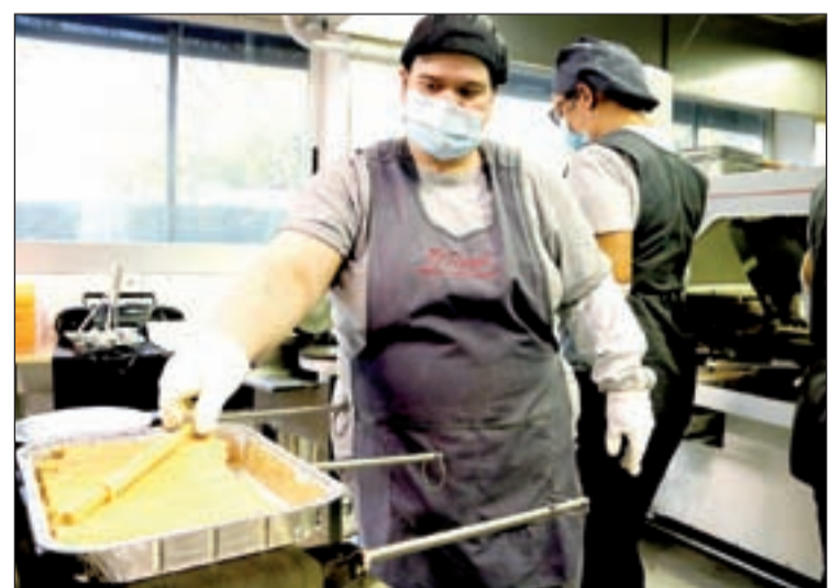
Una treballadora del Rosal elaborant neules

En aquest sentit, asseguren que no els paren d'arribar comandes i confien produir uns 5.000 quilos de galetes que es tradueixen en unes 50.000 caixes. L'obra-dor celebra el centenari i ho fa amb un projecte social consolidat després que fa gairebé 20 anys, la família Serra fundadora del negoci, el traspassés a aquesta entitat que treballa amb persones amb discapacitat intel·lectual.