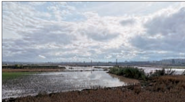
Imatge d'arxiu de les afectacions de la 'Dana' a la Femosa

El Departament d'Agricultura, Ramaderia, Pesca i Alimentació ha resolt favorablement ajuts per valor de 5.412.734,97 euros en el marc de la convocatòria destinada a les explotacions agràries afectades pels aiguats d'octubre del 2019 o pel temporal Gloria de gener del 2020. Les comarques gironines seran les que rebran una major aportació, seguides per les de Lleida, amb més de 2 milions. L'objecte d'aquests ajuts era la recuperació del potencial productiu de les parcel·les afectades per a garantir la viabilitat econòmica de les explotacions. Aquests ajuts s'inscriuen en les mesures urgents impulsades pel Govern per pal·liar els danys ocasionats per ambdós temporals.