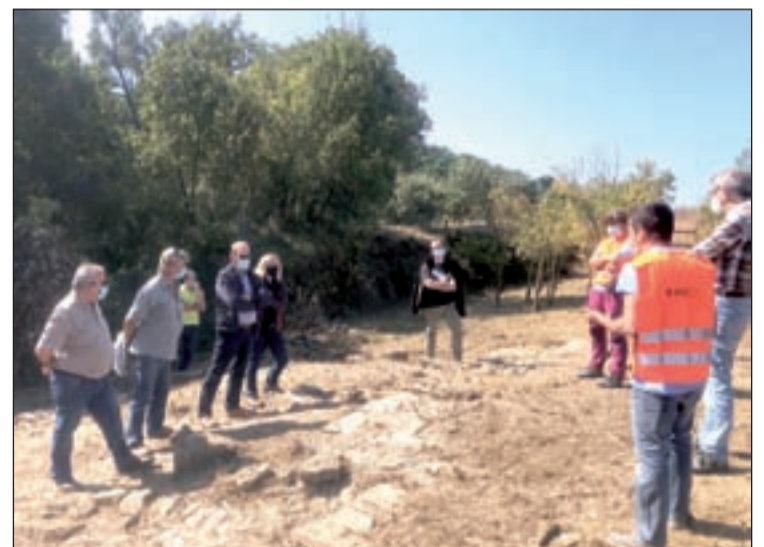
Una de les accions és adequar la Vila Romana de Llorís