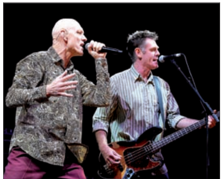
Bones Hillman estaba con Midnight Oil desde 1987

El bajista y vocalista Wayne Stevens, más conocido como Bones Hillman, de la banda australiana Midnight Oil murió el pasado lunes a los 62 años tras una dura batalla contra el cáncer. El músico comenzó en grupos como Suburban Reptiles y The Swingers hasta que en 1987 se unió a Midnight Oil como bajista y contribuyendo con la voz en todos los discos de estudio que la banda lanzó desde 'Blue Sky Mining'.