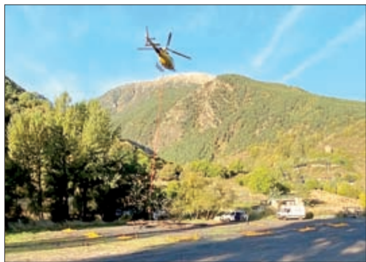
Imatge dels treballs que s'han dut a terme

UP, per la seva banda, valora satisfactòriament el resultat final dels ajuts concedits a les Garrigues i el Segrià, les dues comarques lleidatanes que es van veure més afectades però apel·la al Govern a ser diligent a l'hora de pagar els ajuts per no comprometre la viabilitat de les finques.