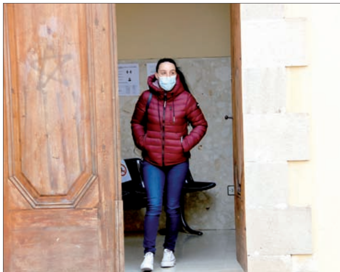
Moment en que l'acusada sortia de declarar dels jutjats de Cervera

D'altra banda, segons les primeres investigacions que s'han portat a terme, el nadó de només