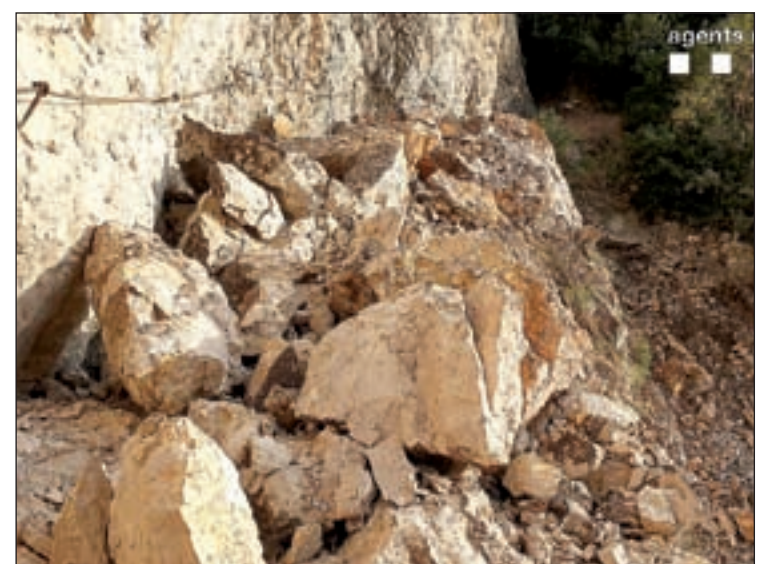
Imatge de les roques que van caure al camí

Cal recordar que el Congost de Mont-rebei és un espai natural molt concorregut pels turistes sobretot els caps de setmana tot i que ara amb les restriccions i el confinament municipal de cap de setmana la presència de visitants hauria de ser mínima.