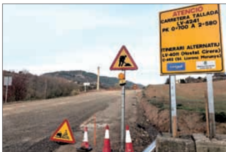
Les millores les executa la Diputació de Lleida

Per la seva banda, la Fundació Catalunya-la Pedrera, que gestiona i protegeix el Congost de Mont-rebei, va recordar ahir, davant d'aquesta nova esllavissada, que la titularitat és municipal però que “estem en contacte i disposats a col·laborar”. Des de la Fundació asseguren que “tenen tot el nostre suport”.