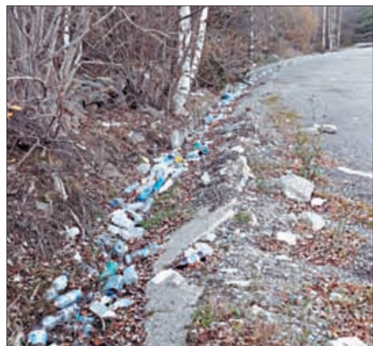
Correspon a una àrea de descans, al tram d'Aragó

En termes generals, dels 808.110 alumnes d'ensenyaments obligatoris del curs 2019 - 2020, un 12,2% es desplacen a un altre municipi de Catalunya per estudiar i un 87,8% estudien al municipi on resideixen.