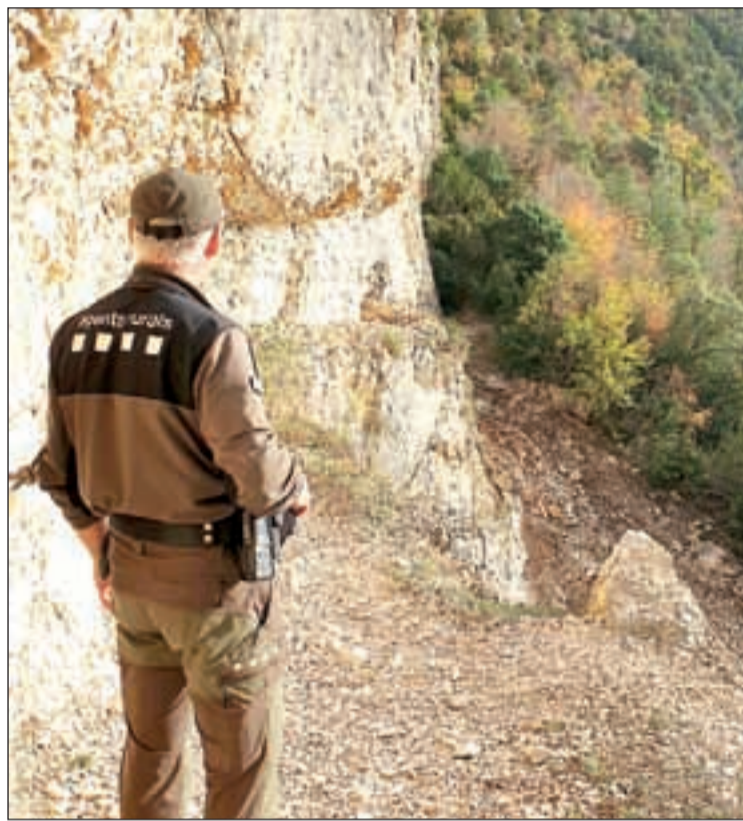
Un agent rural a la zona on es va produir l'esllavissada

El desprendiment va obligar a tancar totes les vies que hi accedeixen i el primer edil va afirmar que fins que no se'n faci una “gestió responsable”, no es reobrirà. Navarra va explicar que tot plegat ja no depèn només de la neteja de l'esllavissada i la reparació del camí, per acabar demanant que es reguli l'aforament. Així, considera que l'espai està “molt mal gestionat” i que al promocionar-se “a tot arreu” registra uns 200.000 visitants a l'any, un volum de gent que amb els mitjans actuals no es pot assumir.