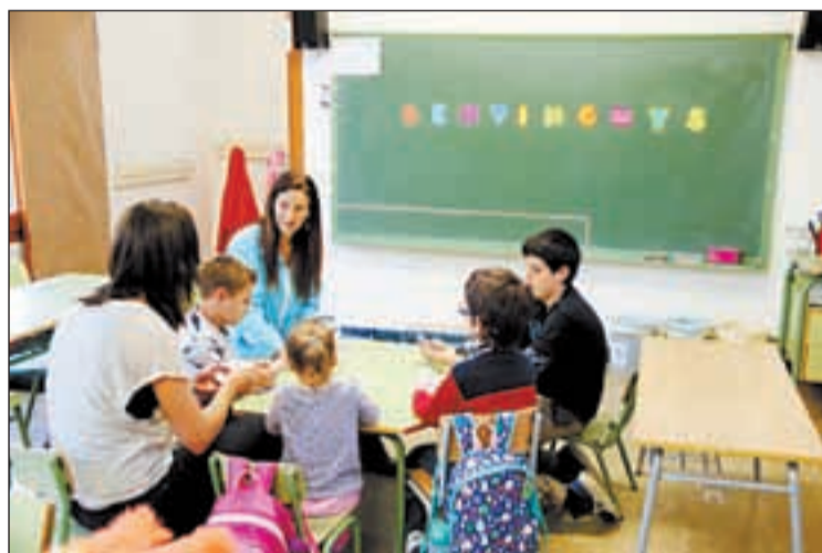
Imatge d'arxiu d'una escola de Tírvia, al Pallars Sobirà

Així ho evidencia una estadística de mobilitat de l'IDESCAT, en la qual es mostra com el Pallars Sobirà té un 38,9% d'alumnes d'ensenyament obligatori que no estudien al seu municipi de residència. Al Sobirà el segueix les Garrigues, amb un 29,9% i l'Aran amb un 27,5%. Així mateix, s'observa com aquests percentatges augmenten quan es tracta dels alumnes que cursen estudis post-obligatoris. En aquest cas, les Garrigues encapçala el rànquing de Lleida amb un 84,4% d'alumnes, seguida del Sobirà amb un 77,8% i de l'Alta Ribagor-