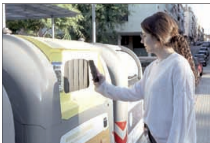
Es recompensarà aquells que reciclin llaunes

quilòmetres a partir de dilluns, fins al dia 27. La carretera es tancarà al trànsit rodat en ambdós sentits de circulació, entre els punts 0+700 i 2+580.