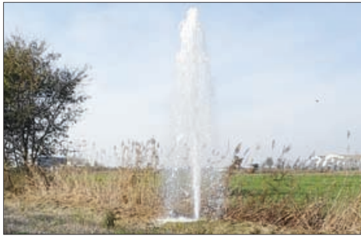
Cap a les 18.00 hores es va poder arreglar l'avaria