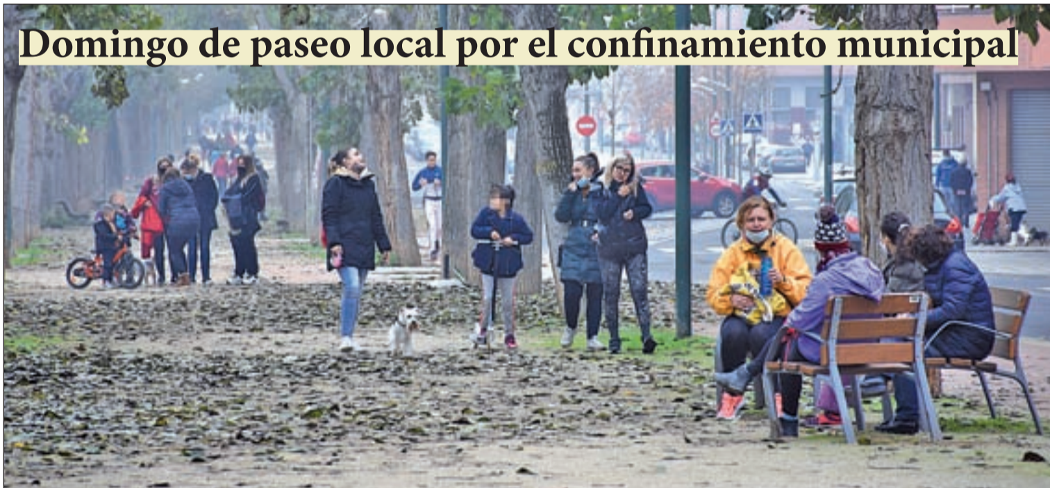
Cientos de personas tomaron las calles de Lleida en zonas como la canalización, el parque de la Mitjana o Ciutat Jardí

Los bares de los micropueblos reclaman la reapertura por su labor social