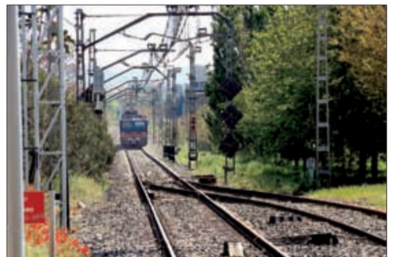
Es vol donar suport a la declaració que va fer la Diputació

Amb aquesta moció, la formació republicana vol expressar el recolzament municipal al front institucional de tots els partits de la Diputació que de forma unànime i consensuada varen aprovar en 3 declaracions institucionals al llarg d'aquest 2020. Els principals punts que conformen aquesta unitat institucional i territorial se situen en el suport a l'informe elaborat per CCOO que emmarca el Pla de Rodalies a les 4 línies que comuniquen Lleida amb Cervera, Montblanc, Monsó i Balaguer i en