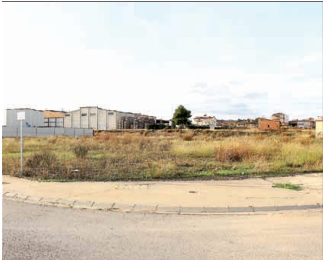
La zona on s'ubicarà la nova nau logística de l'empresa de repartiment urgent

Amb aquesta nova nau construïda al municipi de Torrefarrera, fonts consultades apunten que el més previsible és que hi hagi un trasllat de la nau que Correus Express té a la capital del Segrià, tot i que els detalls d'aquesta operació encara no estan tancats al cent per cent.