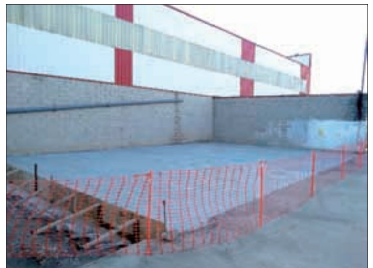
Suposa una inversió total de 41.460,69 euros

La regidoria de Polítiques Feministes i LGTBI ha engegat la campanya 'Cervera lliure d'agressions masclistes', que pretén "obrir finestres i balcons". D'una banda, per fer visible el problema i, de l'altra, per prendre consciència comunitària perquè les violències "no pertanyen a l'àmbit privat".