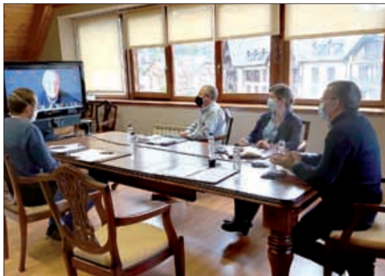
Reunió de l'entitat amb el Conselh Generau d'Aran

proximitat o crear una estratègia de futur que garanteixi un nivell de vida i un dia a dia igual que en les zones urbanes, desplegant serveis de qualitat al territori rural. En concret, es comprometen a promoure la innovació de l'espai rural amb dinàmiques de creixement econòmic, oportunitats de desenvolupament local i augment de la qualitat de vida.