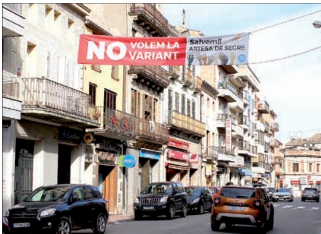
Una pancarta desplegada en contra de la variant

La plataforma 'No volem la variant' ha posat en marxa accions per intentar frenar el projecte com ara la col·locació d'una pancarta al tram de carretera que connecta el municipi amb Trem. Així mateix, ha lliurat 700 signatures que han recollit en contra de la nova variant. Durant dos mesos els establiments han realitzat una recollida i han redactat un manifest per presentar un do-