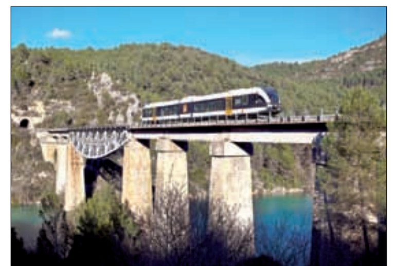
Imatge d'arxiu del tren Lleida-la Pobla de Segur

A la vegada, aquest òrgan servirà per reforçar els vincles d'FGC amb els grups d'interès del territori i conèixer de primera mà les necessitats de mobilitat dels diferents sectors econòmics, a més de recollir els seus interes-