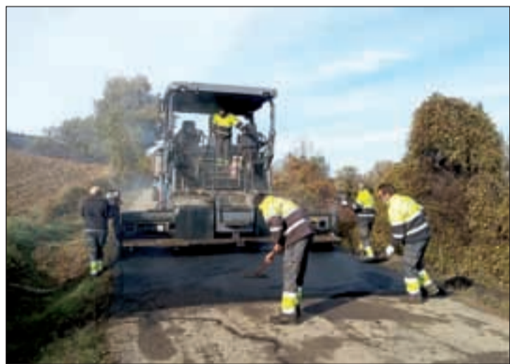
Les obres estan pressupostades per 298.367 euros