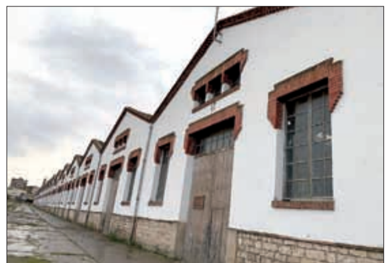
Imatge exterior de les tres naus de Cal Trepapat

Cal Trepapat és una fàbrica de maquinària agrícola que va ser de les protagonistes de la mecanització de les feines del camp a Catalunya i l'Estat durant bona part del segle XX. La conservació fins a l'actualitat de l'antiga maquinària, les naus i la documentació la converteixen en un cas d'estudi singular, motiu pel qual tot el complex s'ha convertit en un Mu-