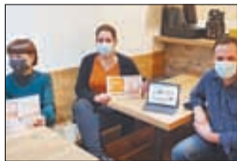
Els impulsors de la guia de locals de restauració

Impulsen la guia 'Mollerussa a la Carta', amb serveis del sector hostaler