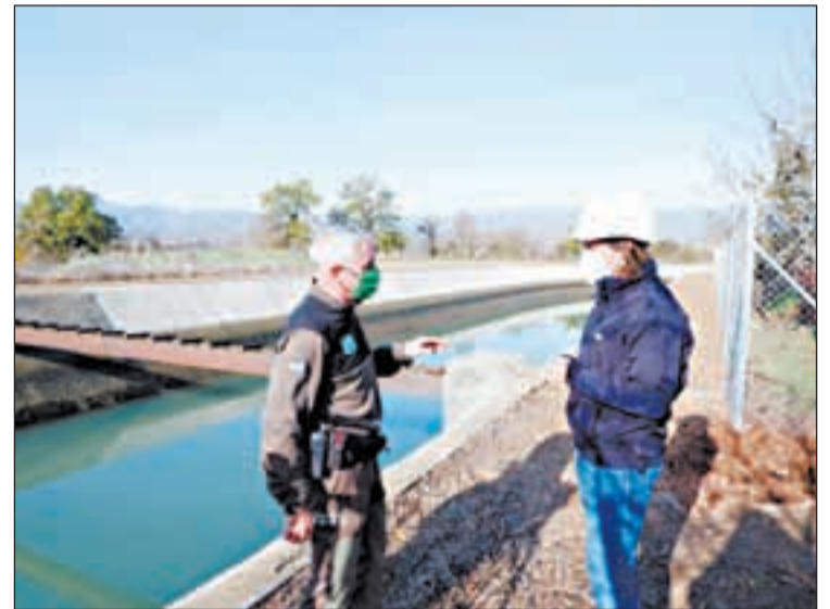
Es realitza amb la col·laboració dels Agents Rurals

Aquestes tasques es duen a terme amb la col·laboració del Cos d'Agents Rurals després de l'anàlisi de la mortalitat de fauna en aquest canal durant els darrers anys. Al canal ja s'hi havien instal·lat 5 rampes per facilitar la sortida dels animals (4 per a ungulats