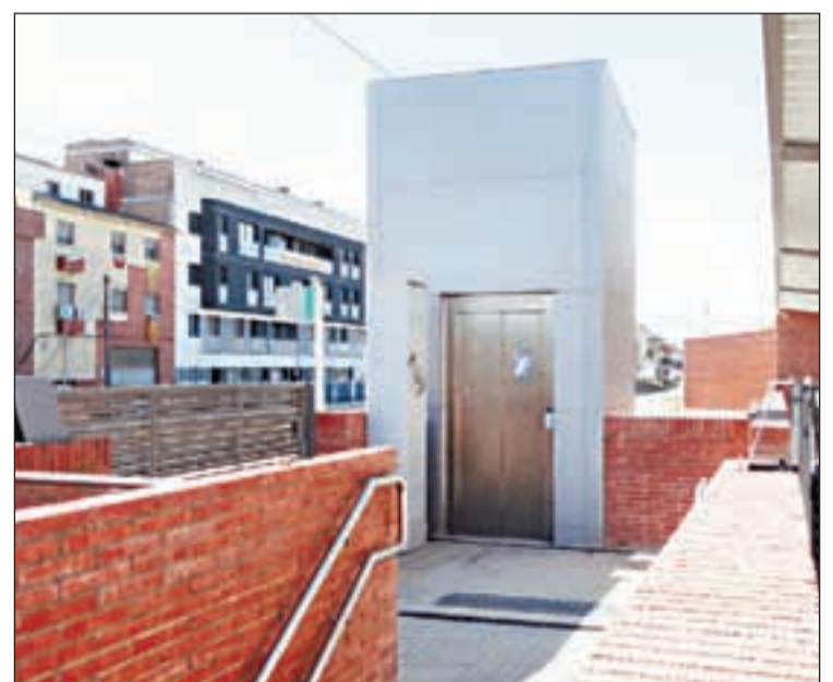
Denúncia que està fora de servei des de l'octubre del 2019

Bastons va denunciar que "aquest és un exemple més de la desídia i la insensibilitat de l'equip de govern, ja que la falta d'aquest servei està provocant un greu perjudici a molts mollerus-