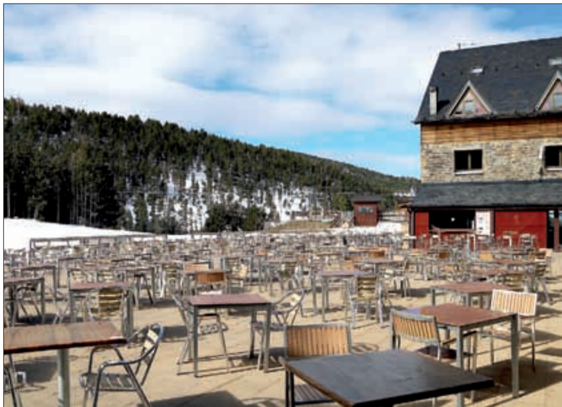
Imatge d’arxiu d’una terrassa de l’estació de Port Ainé buida al mes de març

Respecte a la seguretat, Alsina defensa que les estacions són un lloc segur i que un dels punts on hi pot haver un cert risc són les cues i, precisament per això, és on més s’ha treballat per garantir-hi la seguretat. En aquest sen-