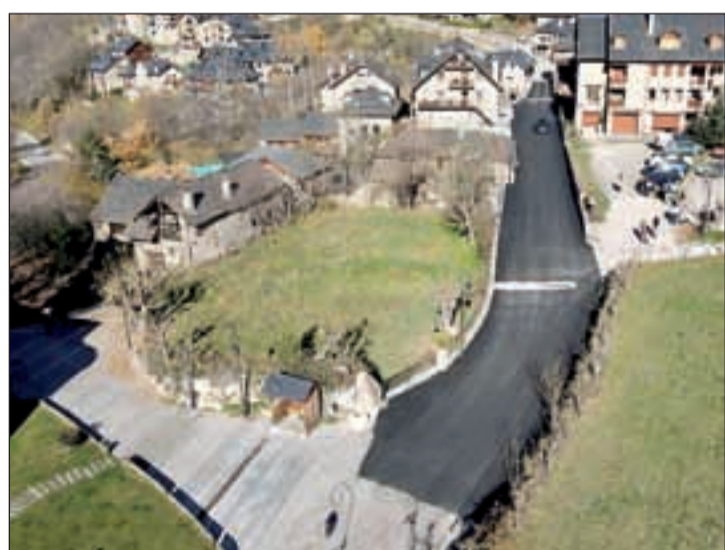
Imatges aèries del carrer d'entrada d'aquest nucli