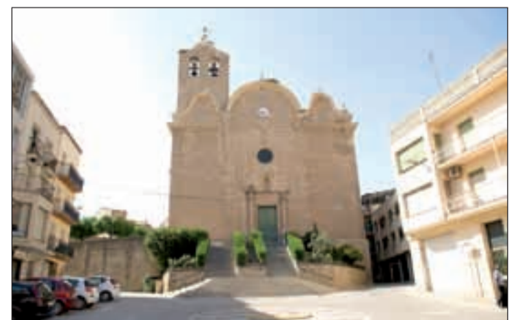
El cost de les obres rondan els 8.000 euros

"Actualment, i per tal d'evitar possibles mals majors, cal actuar a les bigues que sustenten la cúpula del temple i a la teulada. Segons els tècnics, és imprescindible reemplaçar les llomeres actuals per altres de noves. El cost de tot plegat ronda els 8.000 euros i, d'acord amb la parròquia, s'activa ara aquesta recollida de donatius", explica l'alcalde, Ma-