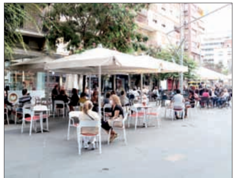
El sector serveis va liderar el creixement el passat 2019

Respecte als efectes del Covid-19 les comarques de Girona i les del Camp de Tarragona se-