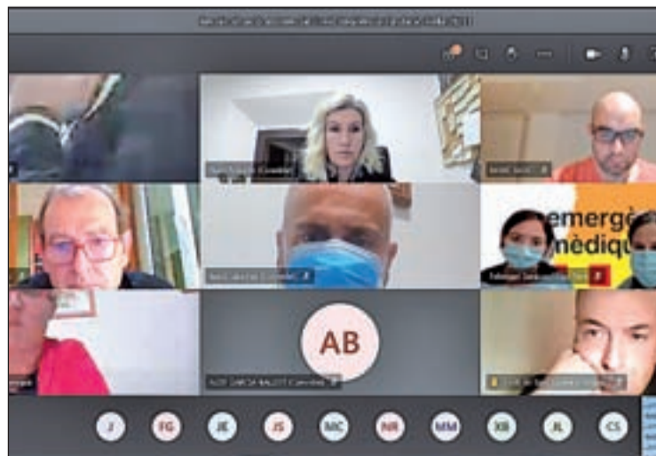
La Delegada del Govern també va participar a la reunió

dència geriàtrica Sant Hospital de Tremp. De fet, en una setmana han pujat de 81 a 176 els positius als centres residencials per a gent gran del Pirineu. Per tal d'estabilitzar la situació al Pirineu, el Departament de Salut començarà, aquest dilluns, cribatges intensius en una vintena de municipis de la Regió Sanitària de l'Alt Pirineu i Aran.