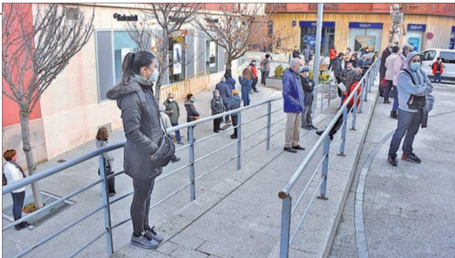
El centre cultural el Casal va acollir la primera jornada del cribatge intensiu impulsat pel Departament de Salut

Aquesta intervenció té com objectiu principal la realització d'un pla d'actuació que garanteixi la viabilitat tècnica de la residència en el seu conjunt en aspectes sanitaris, socials, organitzatius i de gestió de qualitat a curt i mig termini.