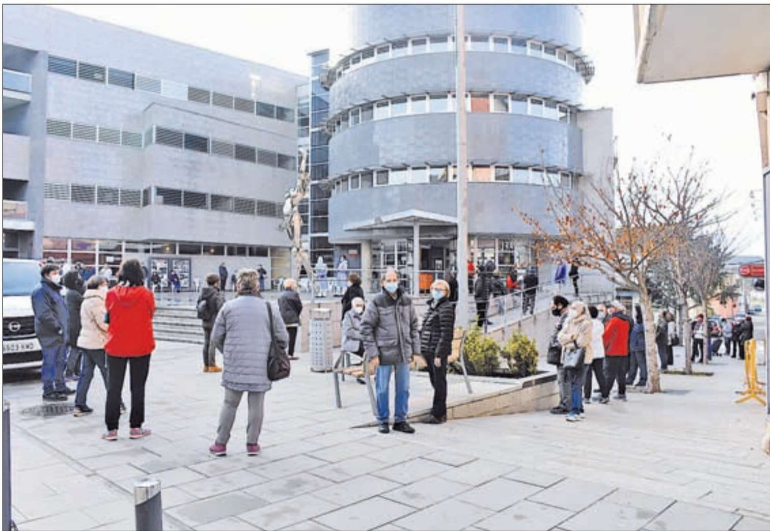
Las colas se repitieron ayer a las puertas del centro cultural el Casal de Almacelles para poder someterse a un cribaje de Salut

✓ El presidente del Gobierno, Pedro Sánchez, ya habla de una tercera ola