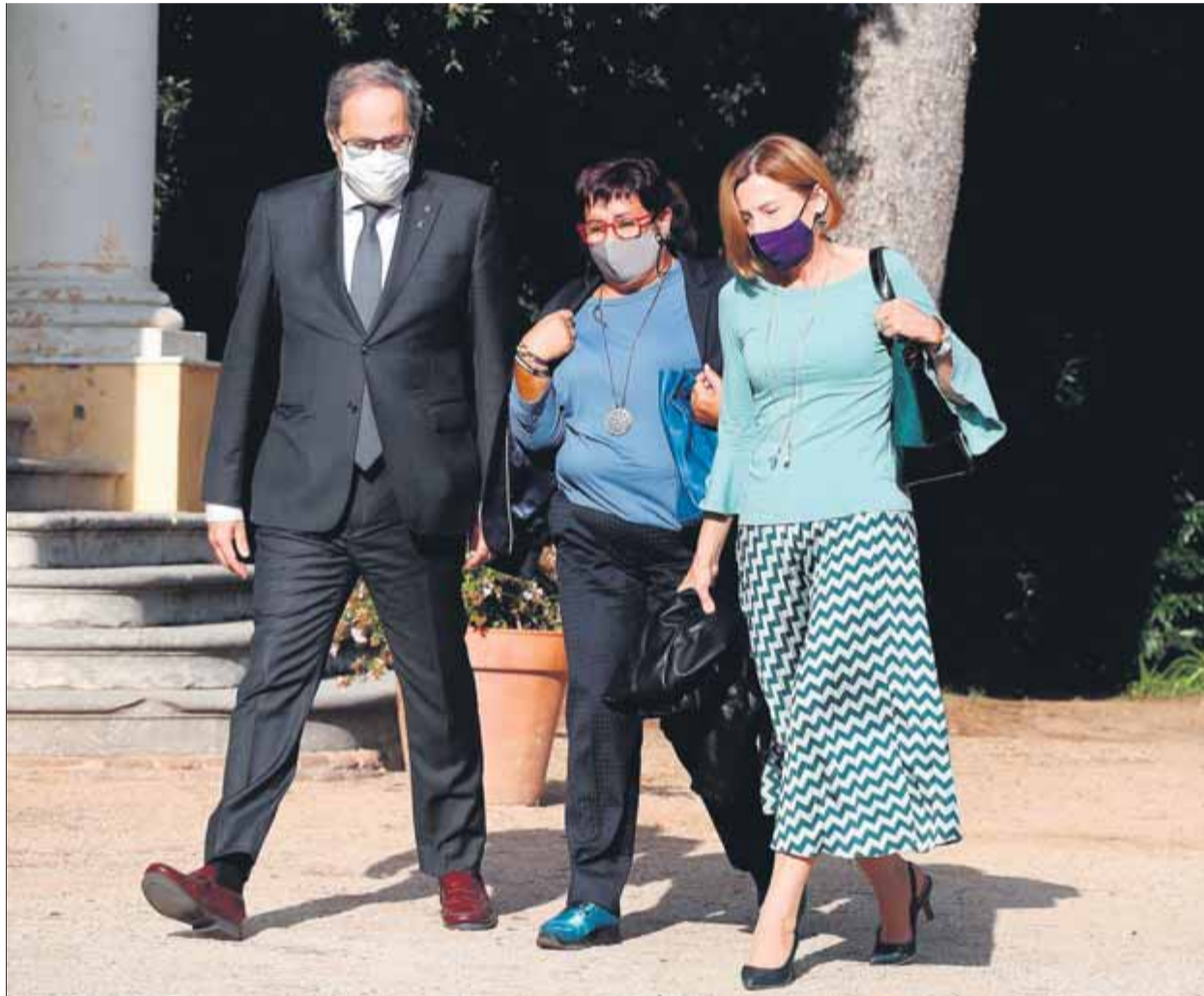
L'expresident Torra, amb l'exconsellera Bassa i l'expresidenta Forcadell, a finals de setembre

En les dues resolucions, el fiscal insisteix que Bassa i Forcadell “no han estat