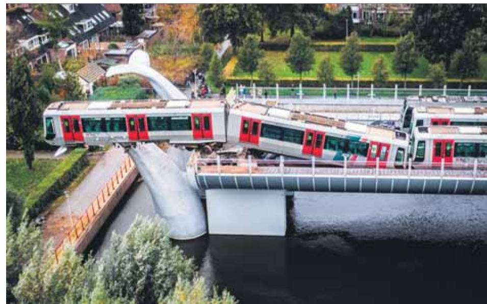
La balena salva el maquinista , que va sortir il·lès d'aquest accident a Spijkenisse (Holanda), després que els frens van fallar. La cua de balena de formigó va evitar una destrossa major