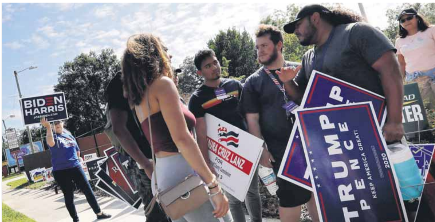
Joves partidaris de Donald Trump i de Joe Biden mostren cartells dels candidats, a Florida, unes hores abans de les eleccions

El sector esportiu, en peu de guerra, porta les restriccions al TSJC