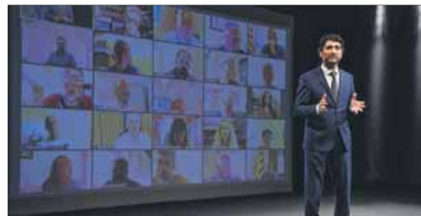
El conseller de Polítiques Digitals i Administració Pública, Jordi Puigneró, durant la presentació telemàtica

L'Agència de Ciberseguretat de Catalunya començarà a oferir als ajuntaments, consells comarcals i diputacions un paquet de serveis i eines integrals de protecció de serveis digitals entre el gener i el febrer de l'any que ve, coincidint amb l'aniversari de la creació d'aquest organisme, i seguint les directrius del Pacte Nacional de Seguretat Digital. Així ho va