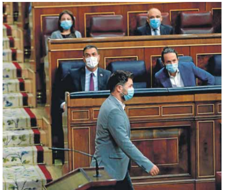
Rufián passa per davant de Sánchez i Iglesias durant un ple del Congrés

Si en algun moment hi podia haver dubtes, ara per ara l'aposta d'ERC –amb Pere Aragonès com a amo de la hisenda i amb funcions de president– és arromangar-se a Madrid i contribuir a aprovar un pressupost que pugui ser una carta electoral d'estabilitat pensant en les eleccions catalanes del 14 de febrer. En l'afany de ser el soci clau al Congrés, però, Rufián no està sol: Ciutadans sumarà també dijous els seus 10 vots amb la coalició PSOE-Podem –i amb ERC, el PNB, EH Bildu i el PDeCAT– per poder