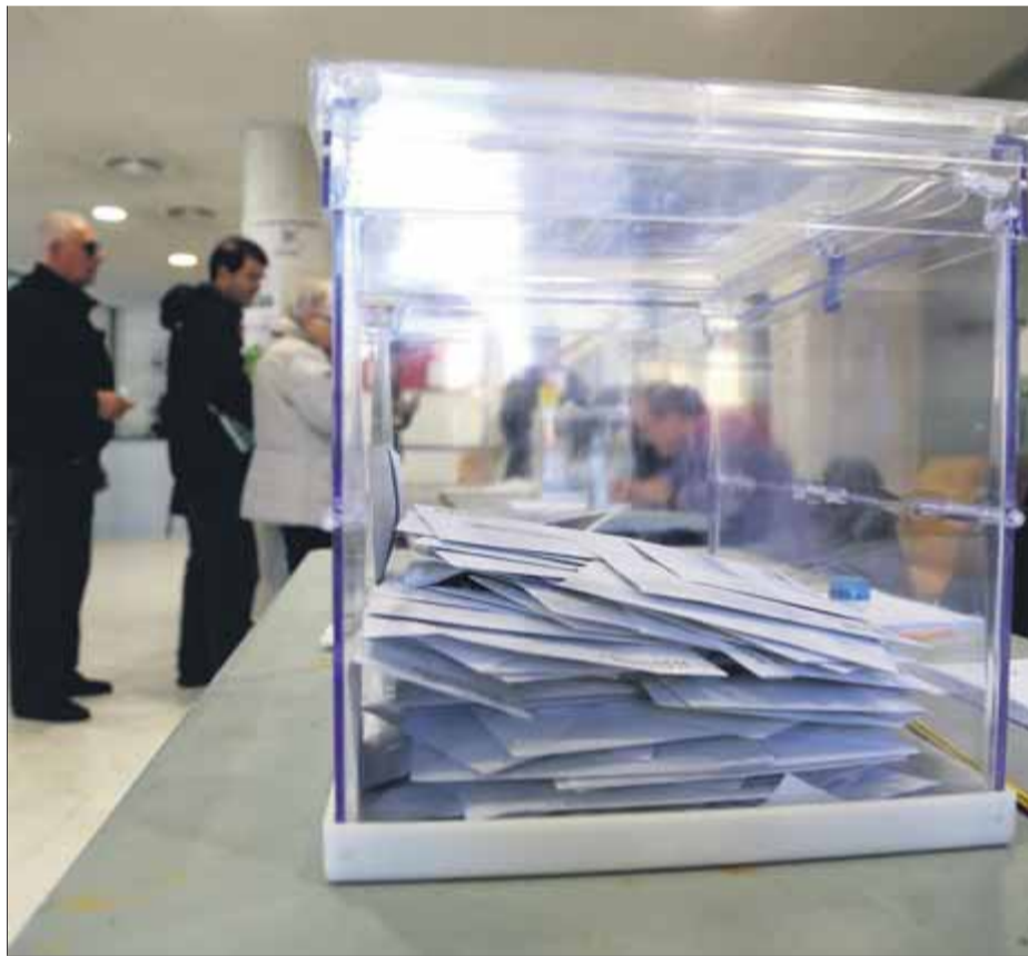
Urna de la jornada electoral del 21-D del 2017 en un col·legi de Figueres

El text planteja que l'estructura i les fronteres dels estats no poden ser immutables en un segle de sobirania compartides i de reconeixement de drets col·lectius i identitats fluides. Els impulsors reivindiquen que aquest no pot ser un "afer intern dels estats" perquè afecta drets individuals i col·lectius que atenyen la comunitat internacional i, en