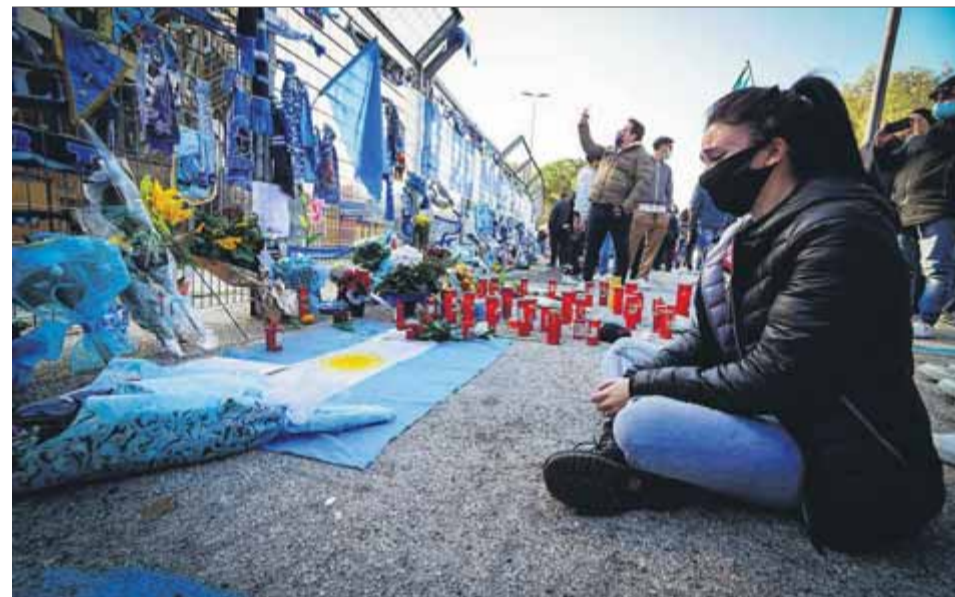
Nàpols també plora Maradona. Una seguidora asseguda al memorial que milers de fans han improvisat davant l'estadi San Paolo, on el crac va juga durant set anys