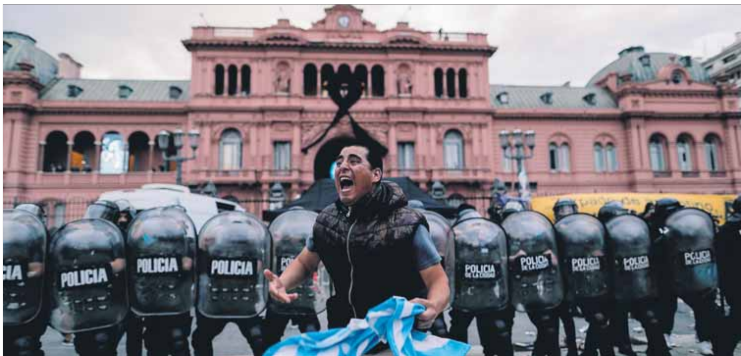
Un fan de Maradona, davant del cordó policial que protegia la Casa Rosada, on es va instal·lar la capella ardent amb el cos del futbolista