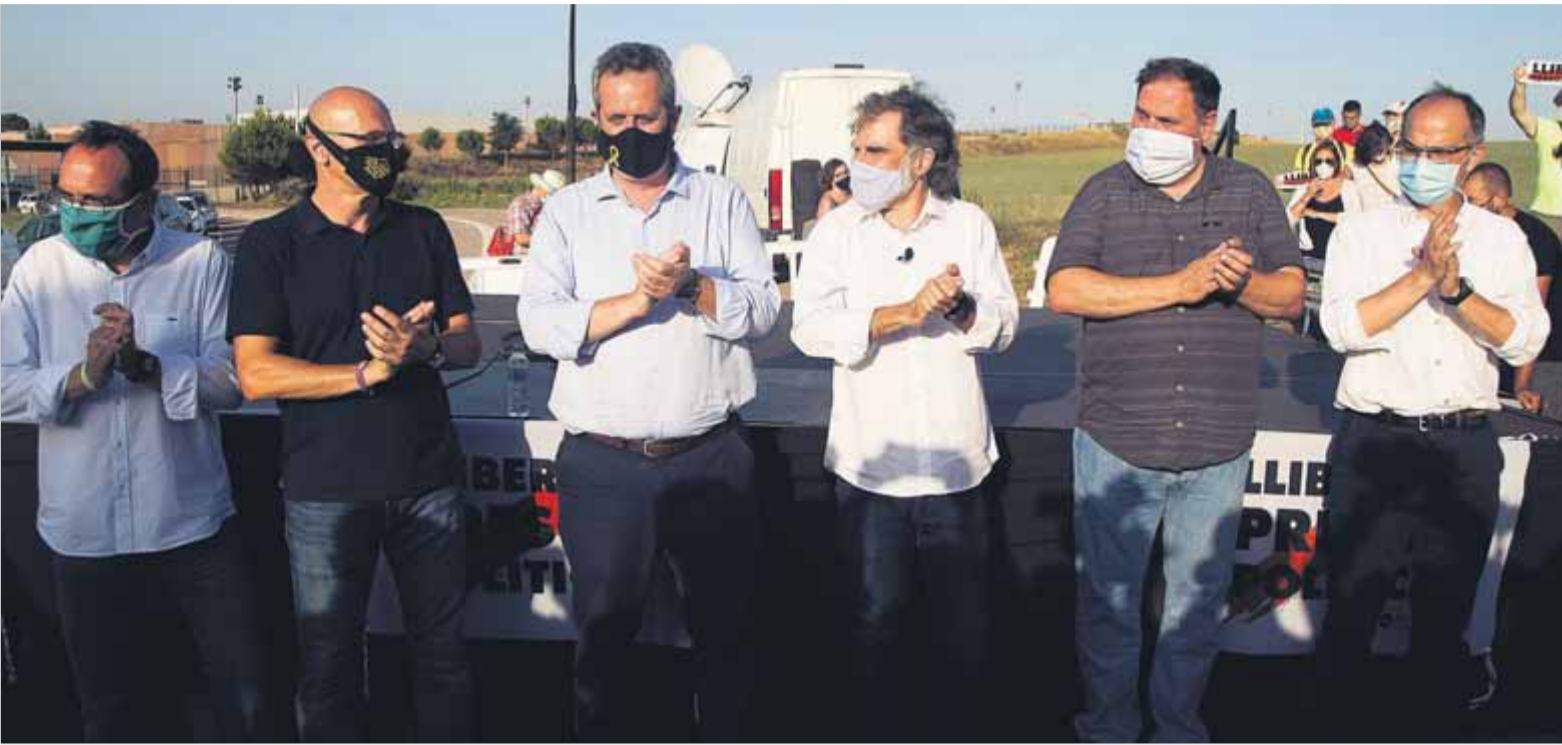
Sis dels presos polítics, en un acte a l'entrada del penal de Lledoners, quan la jutgessa els va suspendre el tercer grau, el 28 de juliol passat ■ ORIOL DURAN