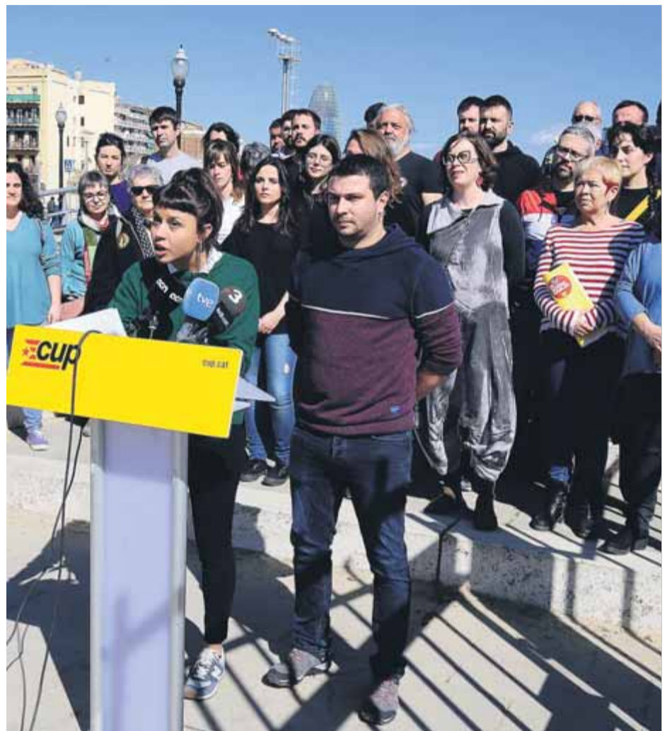
Roda de premsa de la CUP després d'un consell polític el març passat

En el seu compromís per la defensa de l'autodeterminació com un dret col·lectiu, la CUP també incorpora la demanda d'una amnistia per als processats i empresonats els darrers deu anys vinculats a l'independentisme. ■