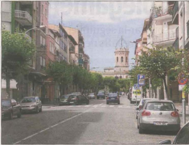
Imatge d'arxiu d'una vista del centre urbà de Tremp.

S'ha de recordar que un promotor busca 700 hectàrees per a grans centrals al Jussà, mentre que alcaldes i la plataforma Salvem lo Pallars s'oposen a aquests macroprojectes (vegeu SEGRE de divendres).