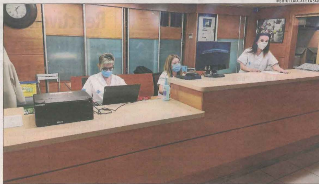
Personal sanitari, ahir a la recepció de l'hotel Nastasi.

Salut ja va recórrer, en aquest sentit, a aquest equipament durant la primera i la segona onades que ha patit Lleida perquè els hospitals puguin disposar de més llits per a malalts més greus. L'hotel va tancar el 10 de setembre després d'haver acollit 89 persones des de l'1 de juliol.