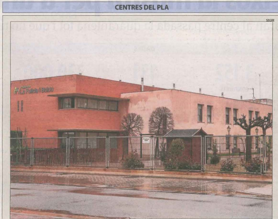
Imatge d'arxiu de la residència per a la tercera edat de la Fuliola.

D'altra banda, els Mossos d'Esquadra adverteixen d'una estafa a residències en la qual els autors truquen als centres per exigir el pagament immediat per una falsa entrega de material sanitari. Segons la policia, no se n'ha denunciat cap cas a Lleida.