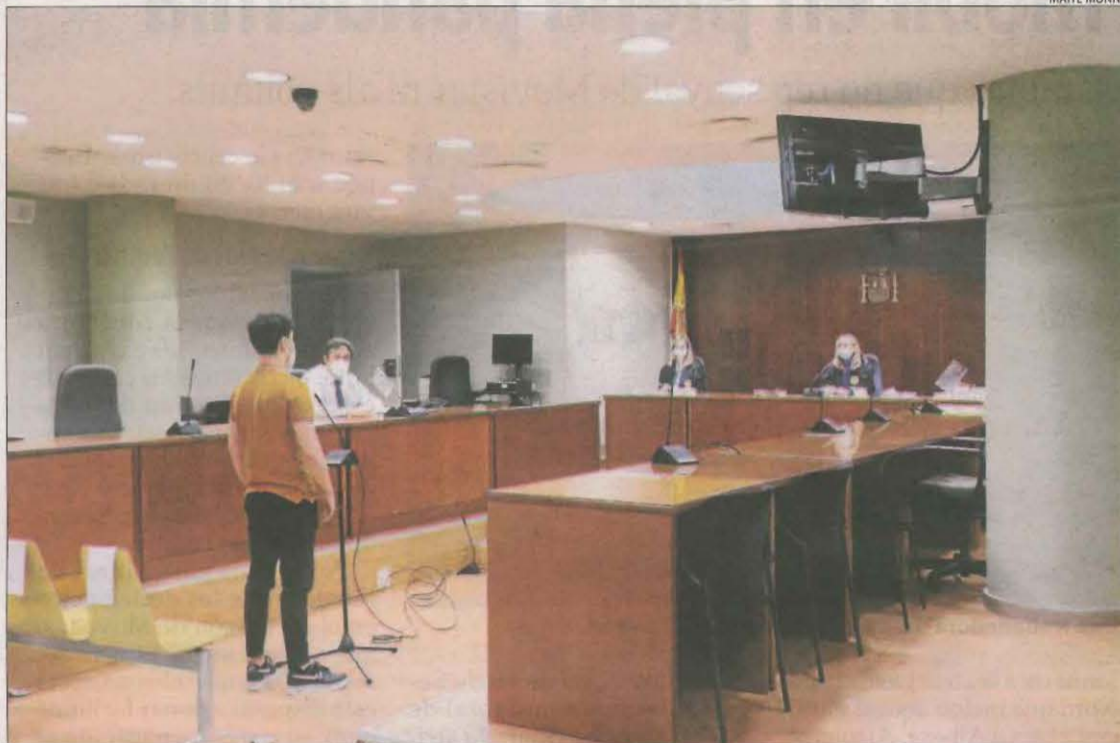
L'acusat, durant la seua declaració ahir al judici celebrat a l'Audiència de Lleida.

Per a la Fiscalia, que va mantenir la petició de condemna de quatre anys i mig de presó per