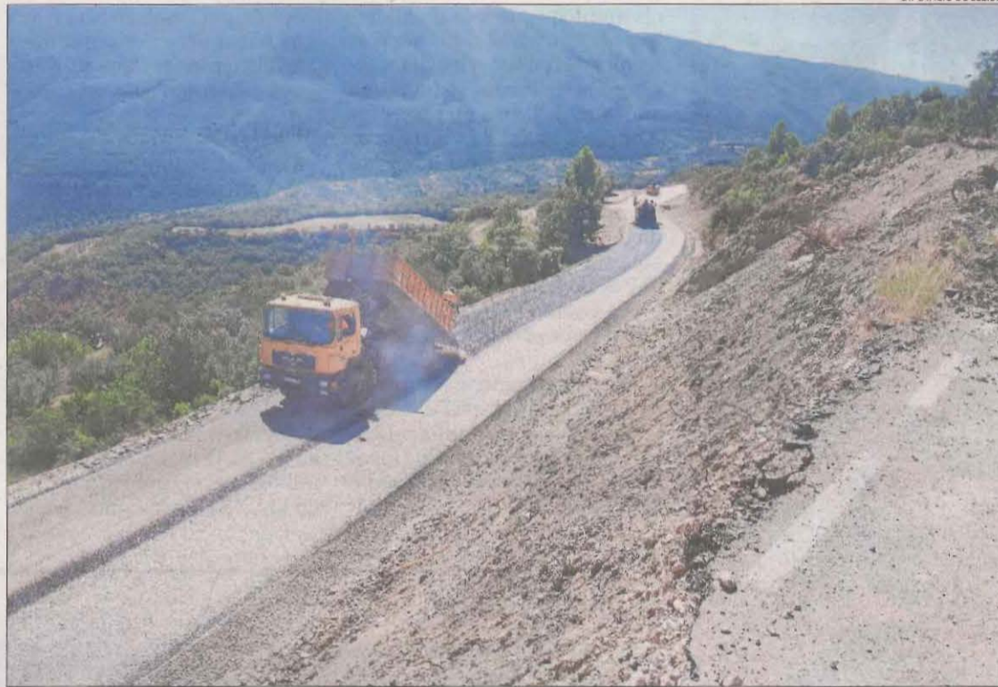
Obres de la variant provisional al tram afectat pel desprendiment.

La família va interposar la reclamació el febrer del 2019 i fins ara no s'havia emès una resolució en aquest sentit. Els serveis jurídics de la Diputació van prorrogar el termini màxim per emetre-la, que era de sis mesos. No obstant, l'agost passat, el president de la cor-