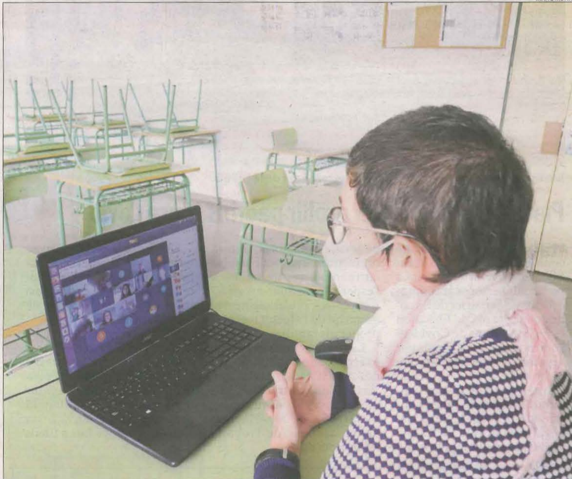
Una professora fa una classe online per a un grup d'ESO confinat a l'institut Maria Rúbies.

va afirmar que els estudiants es poden reincorporar presencialment al centre perquè les evidències "diuen que més enllà del cas registrat no es detecten positius al mateix grup bombolla".