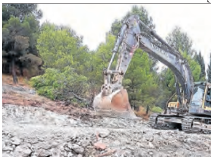
Les màquines ja estan obrint part del camí.

Es tracta d'una operació logística amb l'objectiu de consolidar el patrimoni històric.