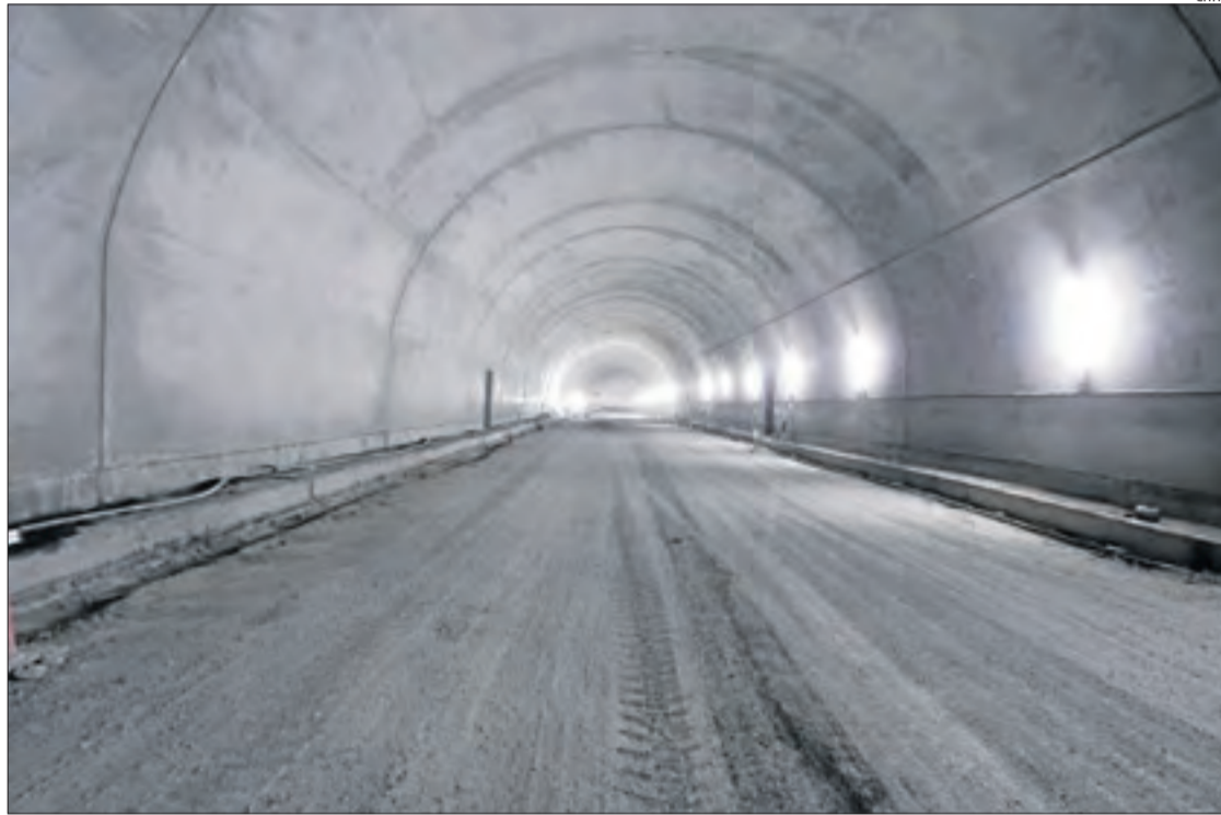
Els operaris treballen en l'actualitat en el recobriments interior del túnel.

Territori va explicar que es treballa en el recobriments de l'interior del túnel i queda pendent la senyalització, les instal·lacions (enllumenat, ventilació, sistemes contra incendis,