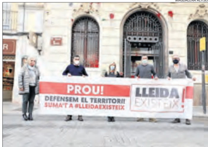
L'acte reivindicatiu celebrat ahir davant del PSC de Lleida.