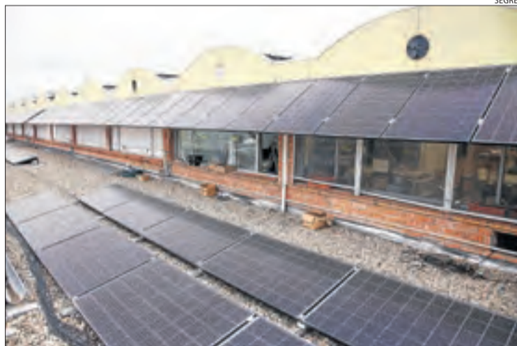
Els plafons tenen una potència de 74 kW.