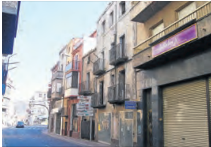
La variant evitarà el pas de vehicles pel centre.

Advoquen perquè aquesta infraestructura es paralitzi o que comenci per Isona en lloc d'Artesa de Segre. Van assegurar que ara són necessàries altres alternatives per reactivar la situació comercial de la població. Tanmateix, els resul-