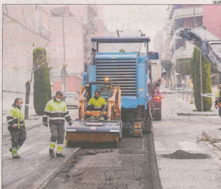
Les obres per renovar el ferm de la C-14 van començar ahir.

(1) És previsible que la reunió de l'Assemblea General se celebri a les 20.00 hores en segona convocatòria, per manca del quòrum necessari en primera convocatòria. (2) La reunió se celebrarà amb compliment de les mesures de prevenció i contenció sanitàries de la COVID-19 vigents segons la normativa d'aplicació.