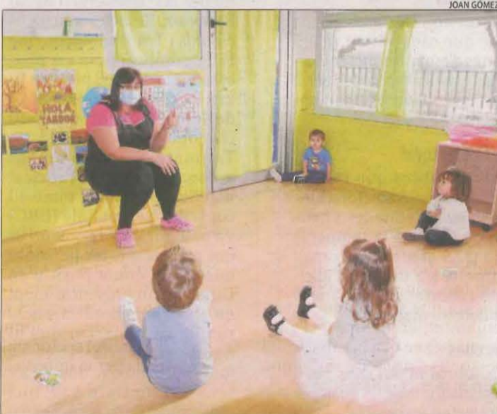
La llar d'infants El Petit Estel de Golmés, de nou oberta.

|| LLEIDA | La llar d'infants El petit Estel de Golmés va reobrir ahir després de tancar pel positiu en Covid d'un empleat, mentre que a l'escola de Sant Martí de Maldà es van reincorporar dilluns els dos grups que faltaven. A la província hi ha 118 classes i més de 2.600 persones confinades. Al Segrià hi ha 67 grups, 6 al Pla i 5 al Solsonès. A l'Escola Pia de Balaguer n'hi ha 4 i l'Institut d'Aran ha recuperat dos classes i en queden quatre en quarantena.