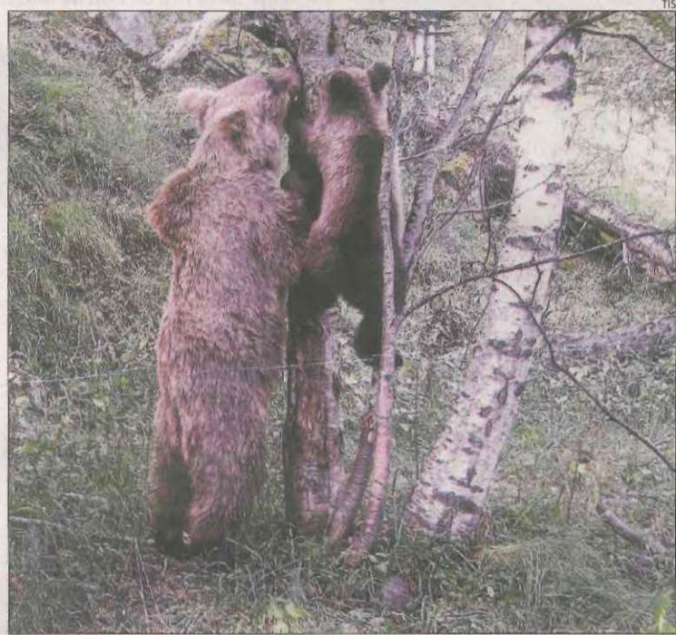
Una óssa i un cadell fotografiats l'estiu passat al Pallars.

femella i un mascle nascuts el 2017, denominats New 18-11 i New 18-10. Aquests tres exemplars s'han sumat al cens de l'any 2019, que ascendeix així