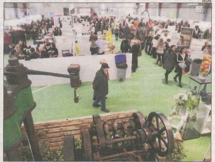
Imatge de la fira de l'oli de Maials de l'any passat.