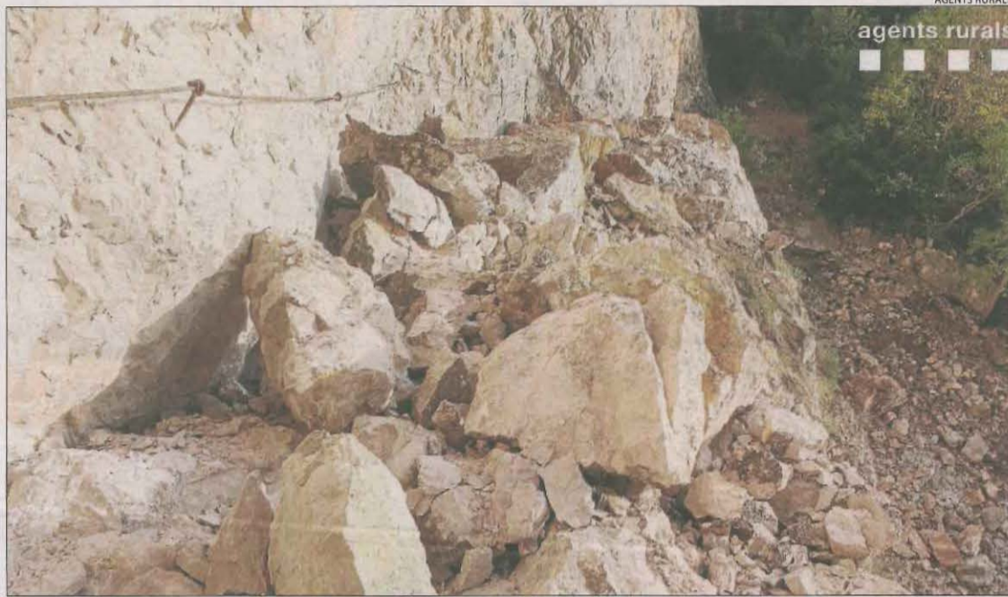
El despreniment de roques del pendent es va endur la base del camí, que pràcticament va desaparèixer.

dels Rurals al Jussà, va apuntar que just en el mateix punt van quedar roques que poden desprendre's en bloc en qualsevol moment. "La base del camí pràcticament ha desaparegut i no hi ha espai per passar, a