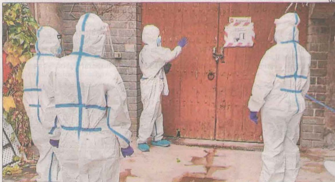
Imatge de la formació dels tècnics a la granja escola La Manreana.

Aquests professionals visitaran els centres i comprovaran in situ si les mesures preventives aplicades o previstes per a les residències s'adeqüen a les recomanacions del departament