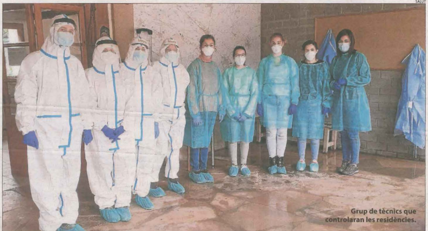
Grup de tècnics que controlaran les residències.

La consellera de Salut, Alba Vergés, va afirmar ahir que el seu departament no pot revocar, com va instar el Parlament, el polèmic contracte de 17,5 milions d'euros pel rastreig de contactes de persones contagiades de Covid-19 que va adjudicar.