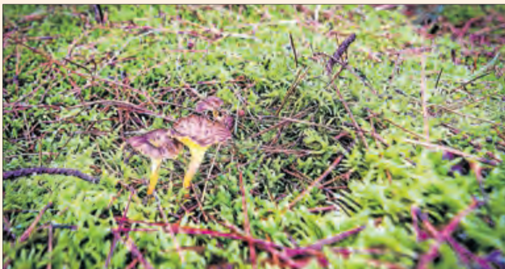
Artístics camagrocs. Una bonica imatge de Jordi Odèn, que es congratula de les pluges recents.