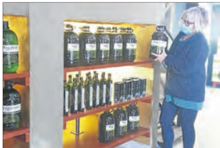
La cooperativa de la Granadella va obrir ahir les portes al públic.