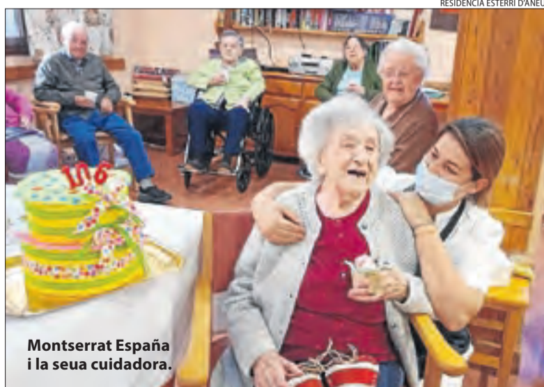
RESIDÈNCIA ESTERRI D'ANEU