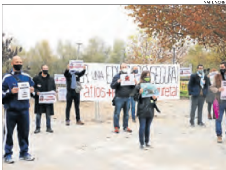
Un moment de la protesta davant del Gili i Gaya.

LLEIDA | Les Escoles de Música d'Iniciativa Privada de Catalunya (Emipac) van mostrar ahir la seua "disconformitat i malestar" pel manteniment de les mesures restrictives que obliguen a prolongar el tancament de les instal·lacions per impartir formació musical presencial. Van explicar que formen part del sistema educatiu amb tots els deures i obligacions pedagògicoadministratives, i que imparteixen classes de música complementàries a les reglades i que, "per tant, no són de lleure extraescolar". Van defensar que les seues instal·lacions són segures, ja que s'han adaptat a tots els requeriments higiènics, de ventilació i de distància. Van assegurar a més que en aquestes escoles no hi ha hagut "ni un sol brot". Van assenyalar també que la mobilitat que generen és "mínima", perquè bona part de l'alumnat que estudia música ho fa en escoles de proximitat.