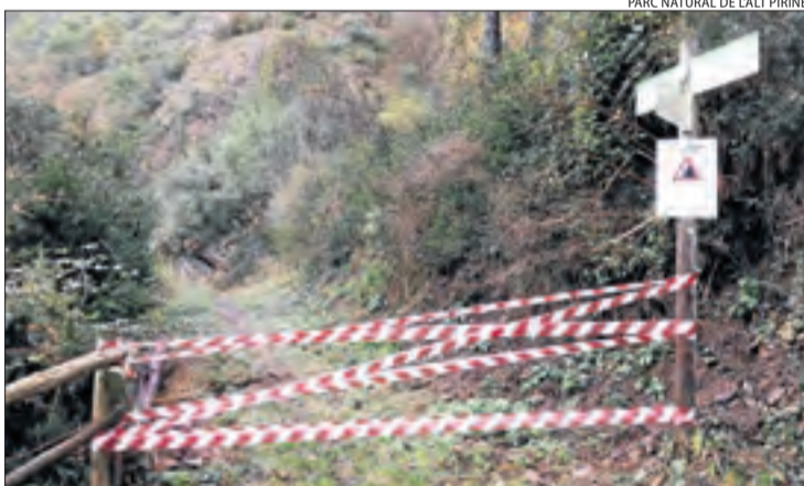
El Parc Natural va precintat l'accés al camí del santuari.

Els mateixos tècnics van explicar que primer caldrà inspeccionar la zona per detectar els punts més inestables on va tenir lloc l'allau i sanejar el pendent en el qual van quedar roques que poden desprendre's. Després s'haurà de refer el camí,