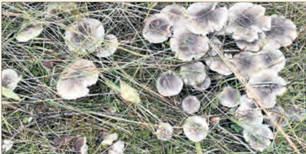
Fredolics. Una colònia de fredolics a la Terreta, Pallars Jussà.