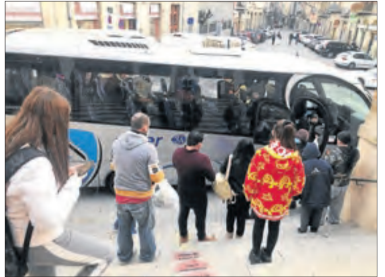
Viatgers pugen al bus que substitueix el tren cancel·lat a Tàrraga.

Fonts del sindicat CGT van explicar que maquinistes de Lleida han treballat amb freqüència en el seu temps lliure per cobrir tornos de conducció, i que Renfe ja els deu més de 200 dies festius. Així mateix, van apuntar que a tot Catalunya hi ha hagut desenes de cancel·lacions de trens només aquest mes per no disposar de personal per conduir-los i van apuntar que l'escassetat de maquinistes en les línies lleidatanes és crònica: han passat de més de 20 el 2018 als tot just 12 actuals, com a resultat de jubilacions i trasllats sense substituïts. Van apuntar