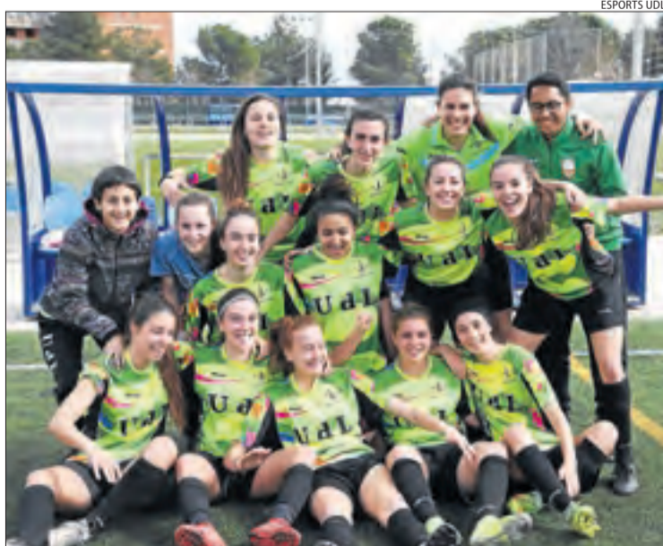
L'equip femení de futbol es va penjar la medalla d'or.