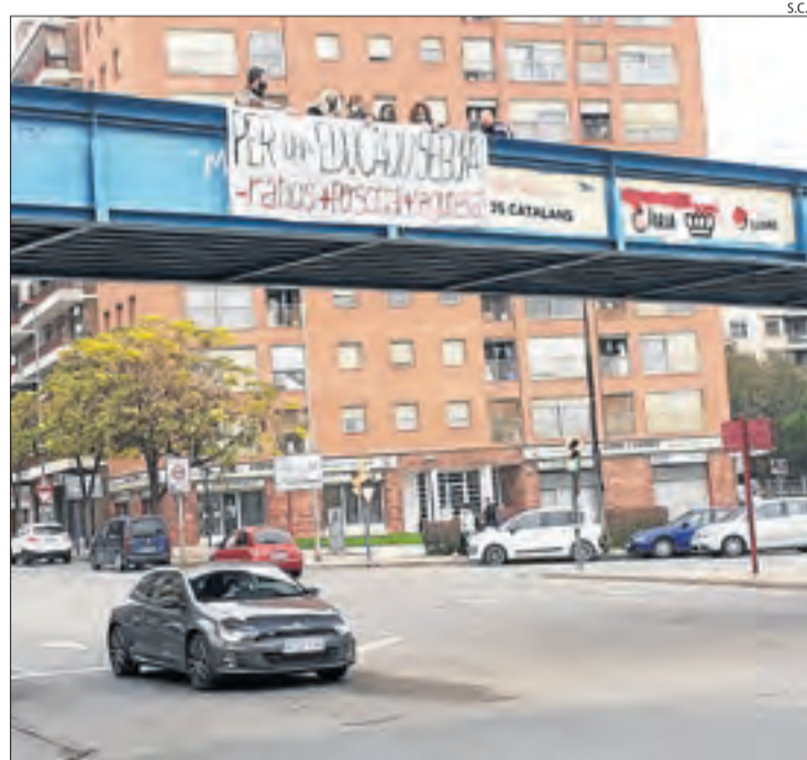
Van penjar una pancarta a la passarel·la dels instituts.

siguin segures. "Nosaltres defensem les classes presencials, però la Generalitat no ha fet els deures i per això la setmana que ve farem una sèrie de mobilitzacions per tot el territori", va dir una de les portaveus de la concentració, en la qual