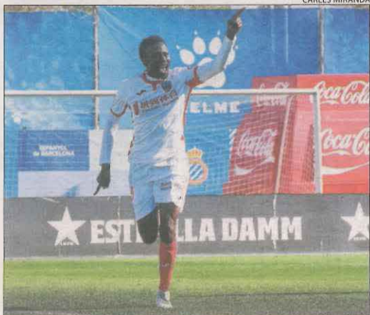
Fall, al marcar el gol que va obrir el marcador.