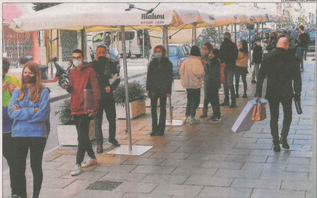
Imatge de cues davant d'un restaurant de Lleida ciutat dissabte.

habitatge. "És un luxe ser aquí, les meues filles s'han adaptat molt bé al col·legi, teletreballem i el temps és molt més eficient. Els serveis, internet i la naturalesa han estat clau per prendre aquesta decisió", va assenyalar en aquest sentit. Tant ella com la seua parella són enginyers de telecomunicacions i el teletreball els permet poder canviar de vida.