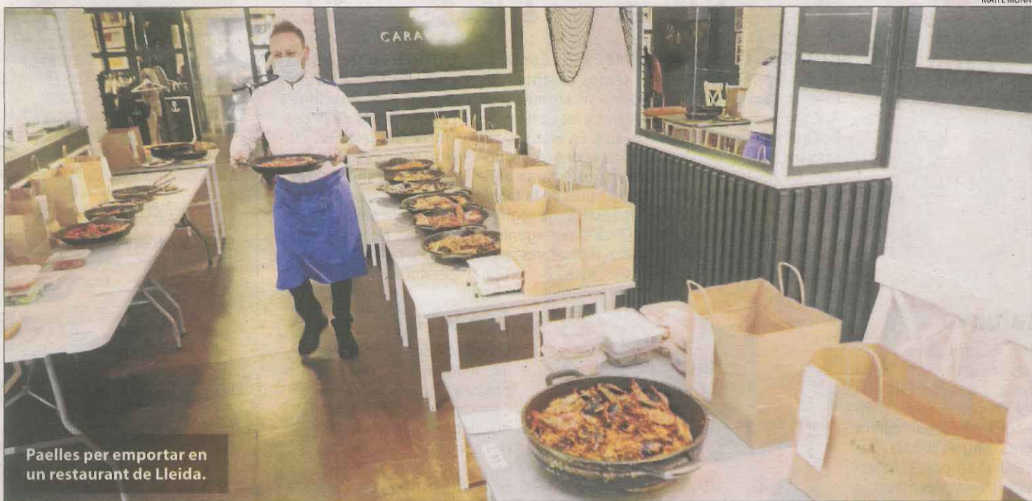
Paelles per emportar en un restaurant de Lleida.

Entorn rural || El teletreball incrementa els veïns de molts altres municipis de Lleida, des de la Val d'Aran fins als Pallars, l'Urgell o les Garrigues