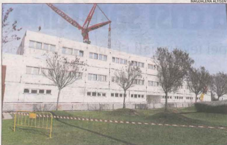
Les obres del nou edifici de l'hospital Arnau de Vilanova.

Així mateix, el risc de rebrot va baixar a la regió sanitària de Lleida i ha passat de 576 punts dissabte a 541 ahir. A la regió sanitària del Pirineu, aquest índex va augmentar lleument