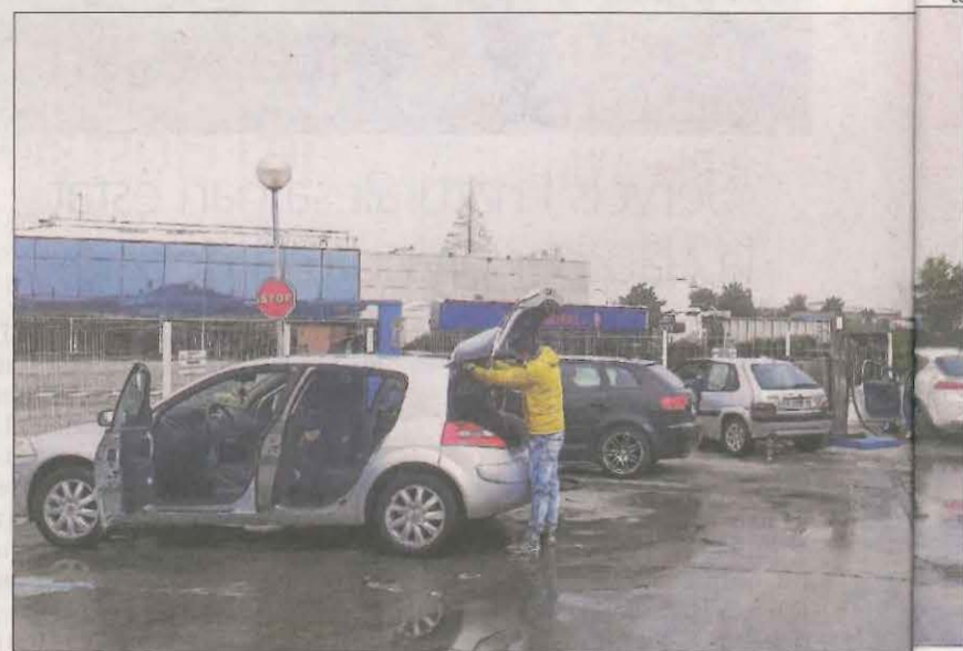
Conductors ahir en un rentador de cotxes a Golsmes.

Així mateix, la Urbana va denunciar penalment el conductor d'un patinet elèctric que va donar positiu en alcoholèmia al segon passeig de Ronda. El conductor va donar una taxa penal, circulava per la vorera i també va ser sancionat per incomplir el toc de queda. Així mateix, un altre conductor de patinet va patir ferides i va ser evacuat a l'Arnau arran d'una col·lisió amb un vehicle a la Bordeta.