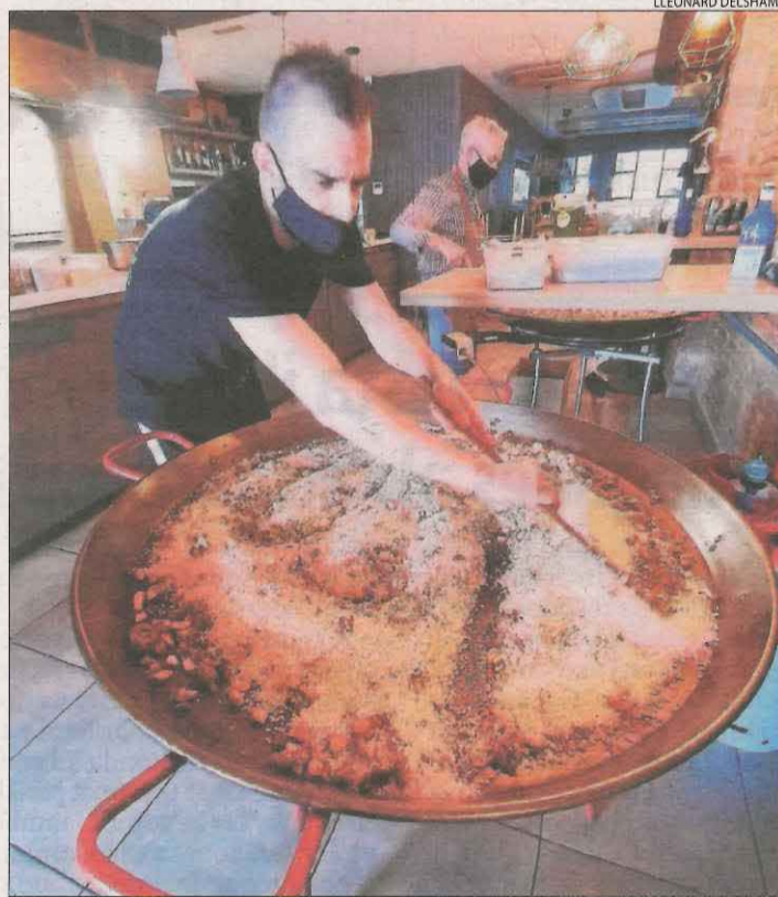
Racions d'arròs a 5 euros ■ El restaurant Bonum No Rules de Lleida va servir dissabte 380 racions d'arròs a 5 euros cada una.