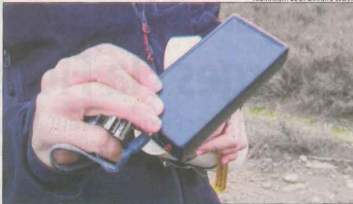
Detall d'un mesurador que s'ha instal·lat a la Granja d'Escarp.