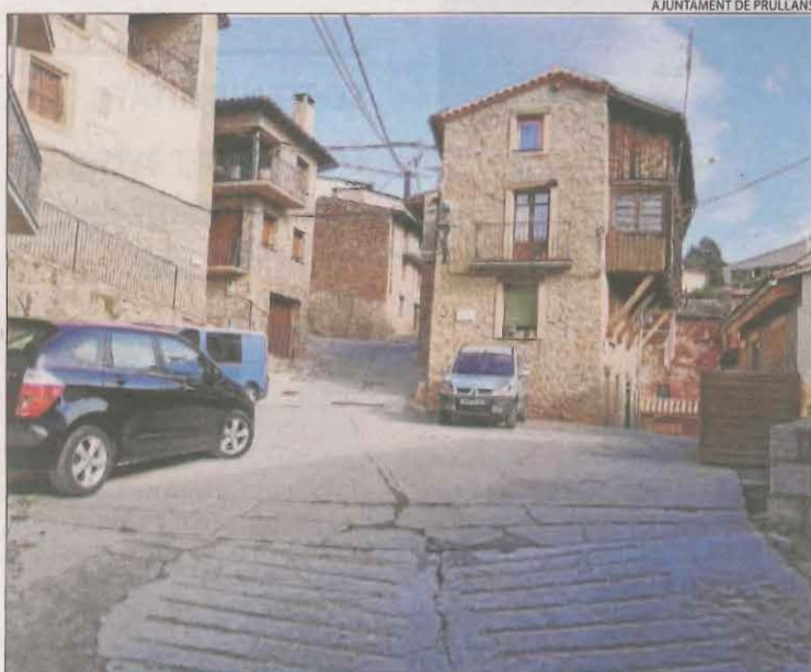
L'actuació es durà a terme al centre històric de Prullans.

Així mateix, demana una andana més al sud per permetre la continuïtat del carrer Sant Crist. La inversió necessària per portar a terme aquestes obres, per ara sense data d'execució, s'estima en uns deu milions d'euros.