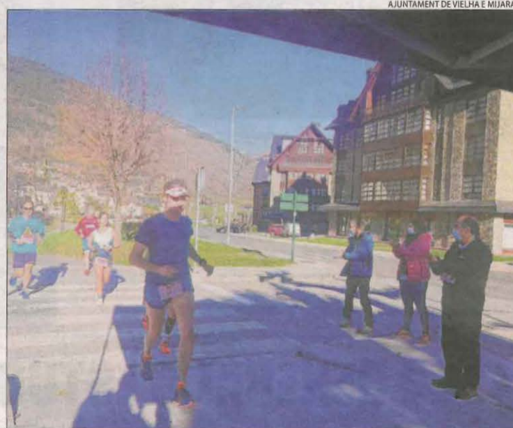
La marató de Vielha es va celebrar diumenge i va vendre 1.000 dorsals.

provocat una aturada "sobtada" de l'economia i calculen arribar a finals d'any a les 30.000 persones ateses a tota la demarcació. Per poder aconseguir el màxim de donacions a la campanya del Gran Recapte "més necessària", animen tota la ciutadania a col·laborar-hi als supermercats i als petits comerços que s'han afegit a aquesta iniciativa. Els interessats també poden fer les seues aportacions a la pàgina web del Banc.