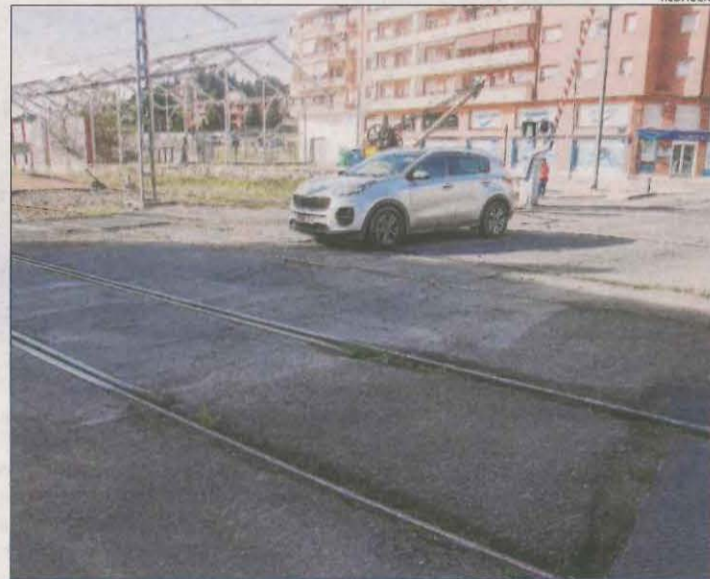
El paviment a la cruïlla de la C-14 amb les vies del tren.

Per la seua part, l'alcalde de Mollerussa i portaveu del PDeCAT, Marc Solsona, va assegurar que la cancel·lació de trens reforça la idea que és necessari traspasar a la Generalitat aquesta línia ferroviària, ara en mans d'Adif i operada per Renfe. En aquest sentit, Solsona va remarcar que el model actual "és obsolet" i va apuntar que la pandèmia "ha posat en evidència" les necessitats d'aquesta línia, que requereixen de "més freqüències i més personal".