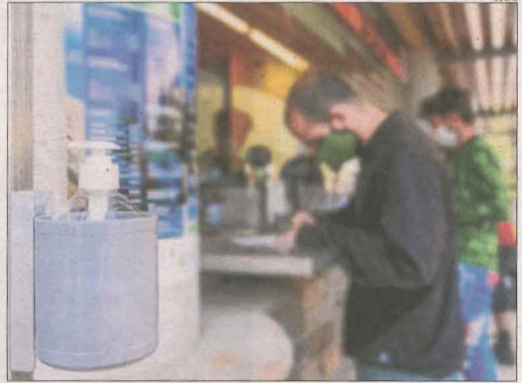
Equipaments per a la higiene per la Covid en estacions de FGC.