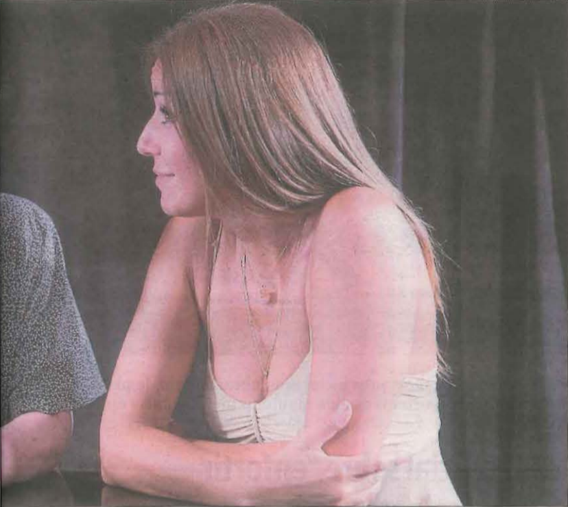
Inaugurar el Jazz Tardor dijous vinent, dia 26, a l'Auditori de Lleida.