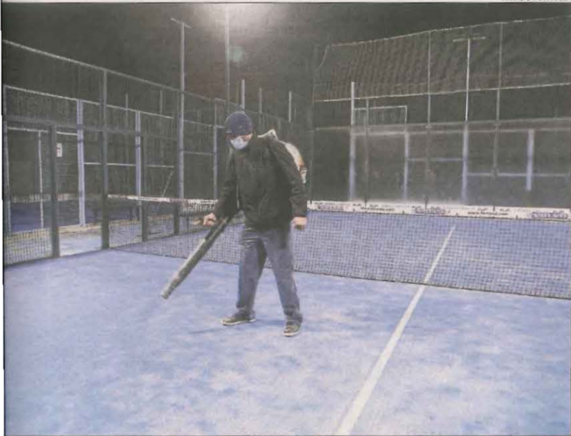
Un operari del CN Lleida, ahir preparant una pista de pàdel.

de Verdú a la qual ha dotat d'un sistema de climatització.